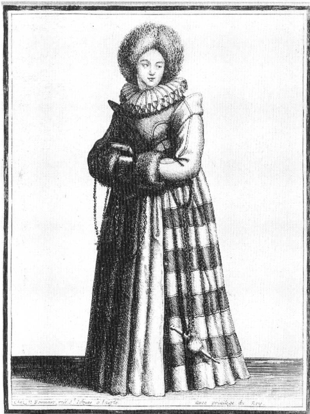
Femme de la ville de Solothurn en Suisse.