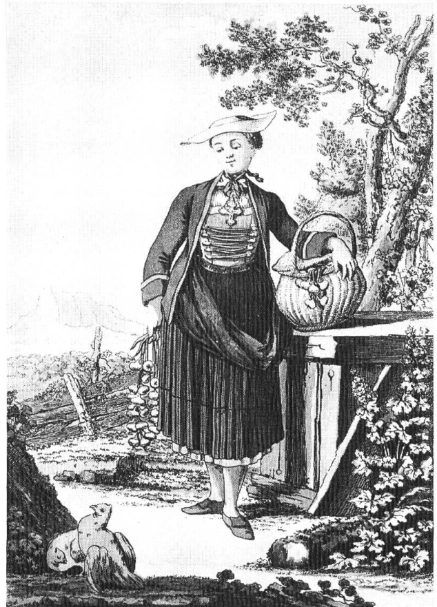
3 Bäuerliche Alltagstracht der Frauen im 18. Jahrhundert.

geliefert worden waren und für drei Schweine, die zum Verzehr ins Katharinenhaus gebracht wurden. Der Köchin im Thüringenhaus wurde täglich ein Mass, d. h. 1½ Liter Wein und wöchentlich 9 Brote verabreicht; die Köchin im Katharinenhaus durfte täglich einen Schoppen, d. h. etwa 3½ dl Wein und wöchentlich 3 Pfundbrote in Empfang nehmen. Fische und Schabziger wurden (mindestens 1761) durch eine «Gutschrift» in Geld ersetzt, offenbar infolge eines (vorübergehenden?) Mangels an solchen Viktualien. 7