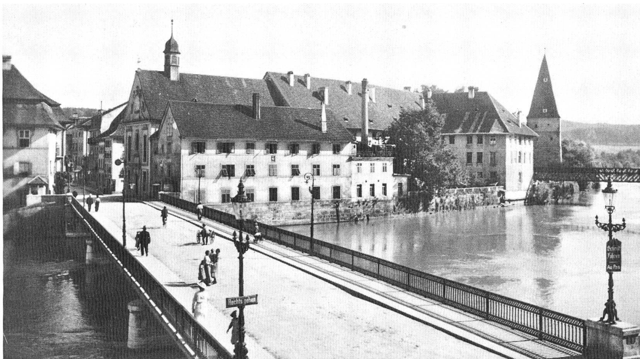
Wengibrücke mit Blick auf das Alte Spital. Auf der Tafel rechts liest man: «Schritt Fahren — Au pas».

1897 und 1901 stattgefunden haben. Der fragliche Zeitpunkt war damit enger umgrenzt. Auf der ZBS liess ich mir anschliessend die Jahrgänge 1897 und 1898 des « Solothurner Anzeigers ». In der Sonntagsausgabe vom 9. Januar 1897 heisst es über die GR-Verhandlung vom 7. Januar unter Punkt 6: «Als Schlussakt wurde über nicht weniger als 35 Strassenbenennungen diskutiert». Im Bericht über die GR-Verhandlungen vom 28. Januar 1898, Punkt 2, steht: «Eine Anzahl Strassenbenennungen, welche in der letzten Sitzung beschlossen wurden, werden in Wiedererwägung gezogen und definitiv die Bezeichnung von 35 Strassen und Plätzen endgültig erledigt und dieselben später dem Publikum zur Kenntnis gebracht».