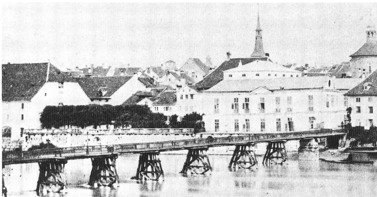
Kreuzackerbrücke und Palais Besenval. Ausschnitt aus einer Foto vor 1878. (Foto: Ad. Braun, Dornach. Repro: Markus Hochstrasser, Solothurn).