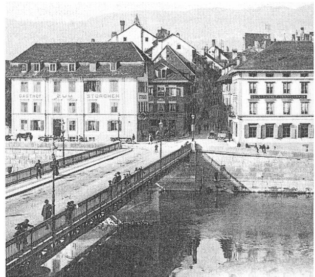
Wengibrücke mit Landhausquai. (Alte Postkarte, Ed. Phot. Franco-Suisse, Bern).

Gestützt auf diese Protokollhinweise mussten die Namenänderungen zwischen