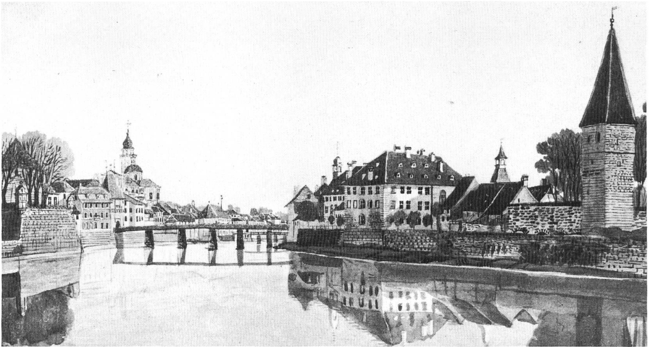
Wengibrücke. Ausschnitt aus einem Aquarell von Franz Schmid, um 1810/20. (Graphische Sammlung ETH, Zürich).

ist dagegen schon im Plan von 1870 eingetragen.