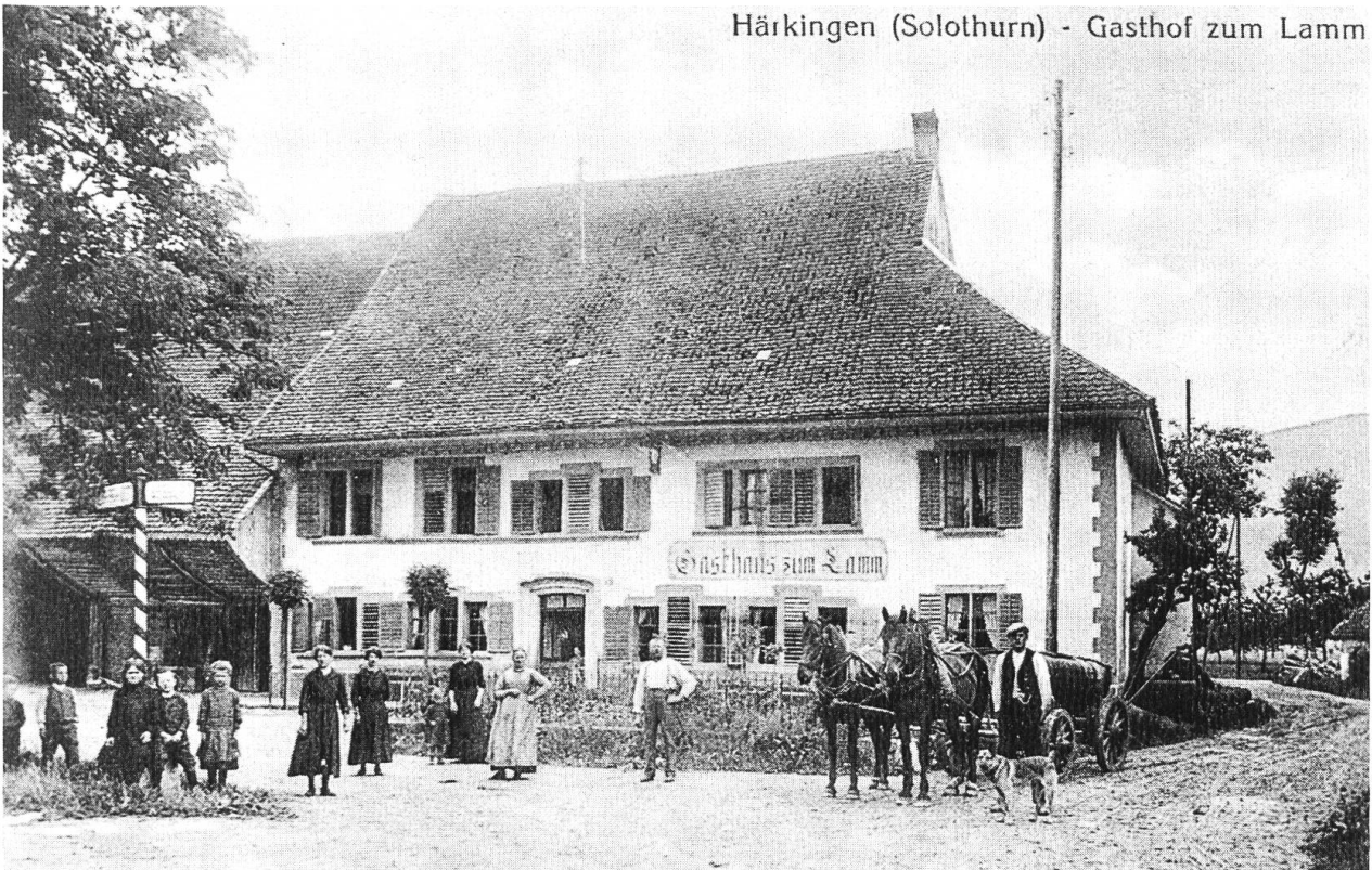
Um 1915. Das ehrwürdige Gasthaus mit spätgotischen Fenstern; im Erdgeschoss zwei volutenverzierte Doppeldreiergruppen.