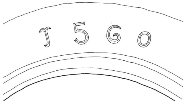
Der Keller von 1560 fand nach dem Brand von 1585 neuerdings Verwendung.