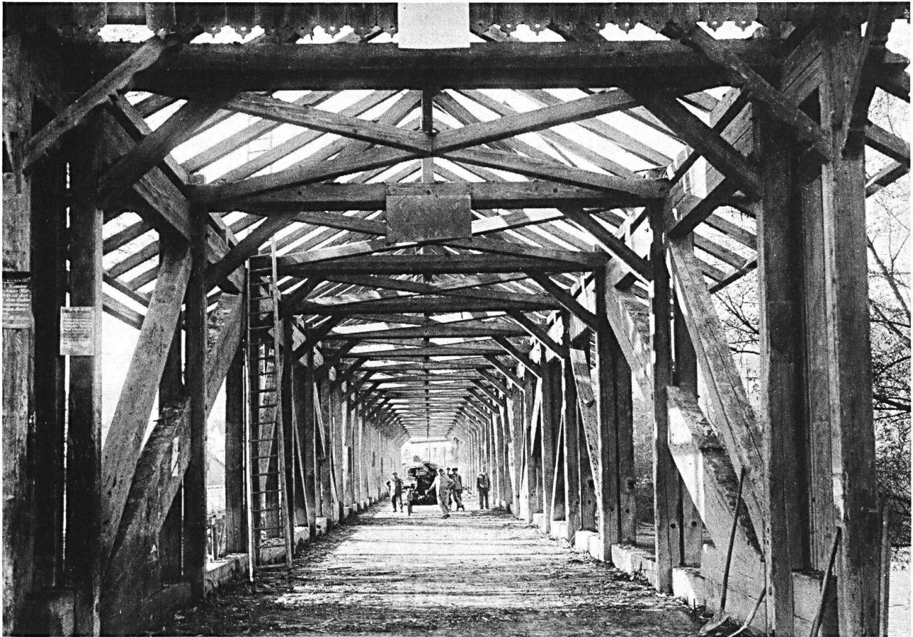
Abbruch der alten Brücke 1927.