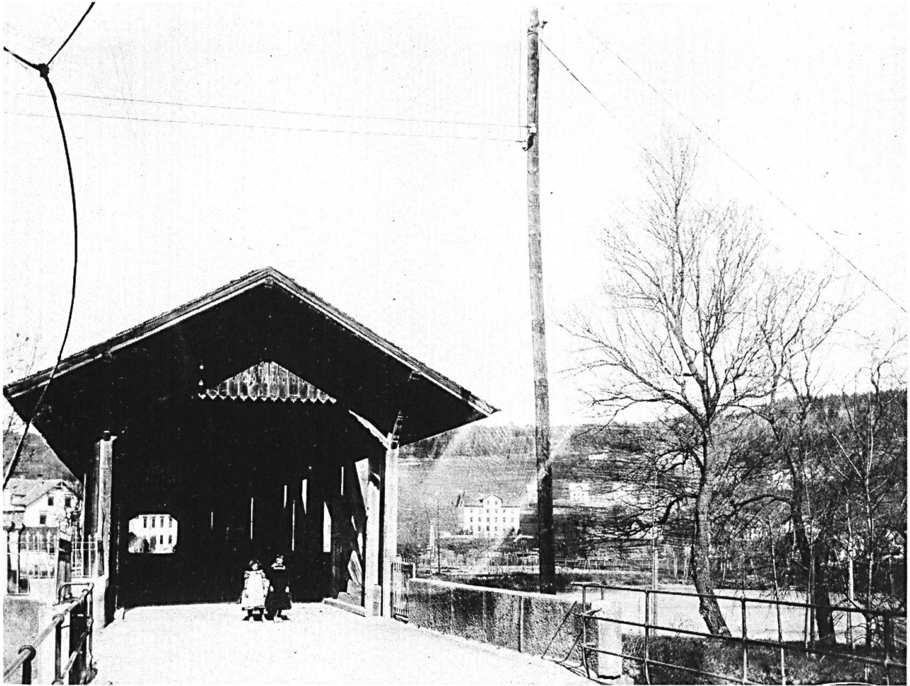
Holzbrücke Niedergösgen-Schönenwerd 1864.