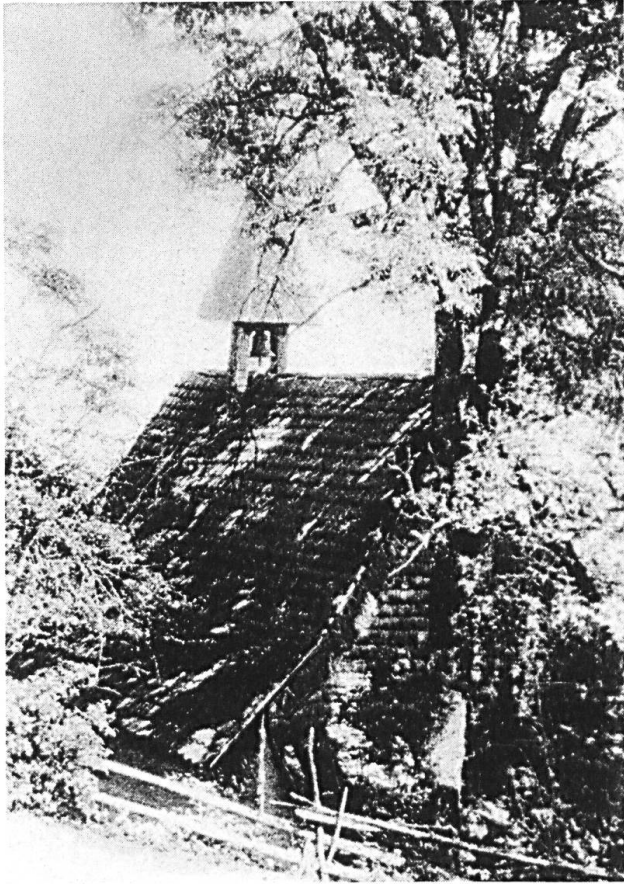
Die Allerheiligen-Kapelle kurz vor ihrem Abbruch. Foto 1904.

ten. Ein Bericht aus der Mitte des 19. Jahrhunderts führt einiges davon auf: Viehschäden, Lähmungen, Hautausschläge, Bettnäsen . . . Die Wände der Kapelle füllten sich mit Votiv-Inschriften, Krücken, Ruten, hölzernen und gipsenen Armen und Füßen und anderem. 15 Noch 1858 wurden von Richenwil her Kreuzweg-Stationen bis zur Kapelle hinauf angelegt. 16 Dann aber begann es rasch stiller zu werden um das kleine Gotteshaus.