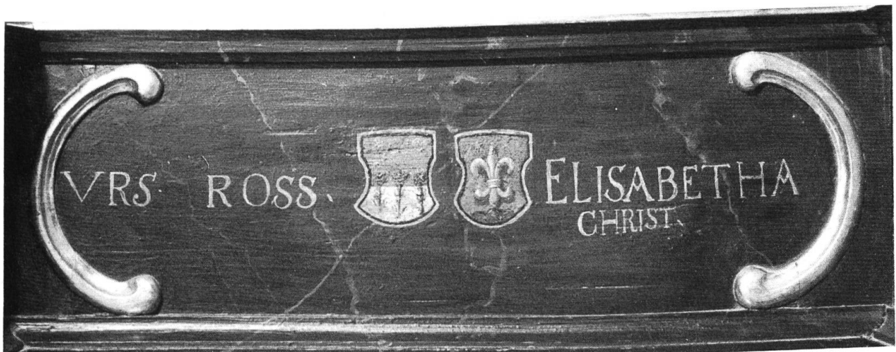
Die Sockelpartie des Retabels mit Namen und Wappen des Stifterehepaares.

ten und vierten Verwandtschaftsgrad erhalten hatten. Die Eheschliessung fand in Balsenthal statt. Das dortige Eheregister gibt die Limmern als genauen Herkunftsort der jungen Frau an.