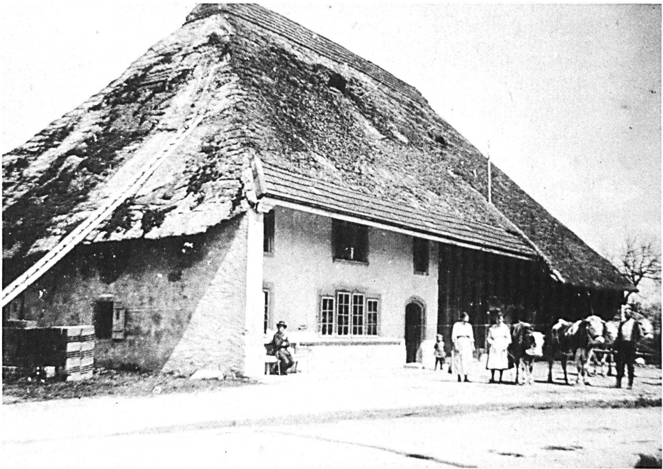
Der Hof Nr. 29 anno 1919, kurz bevor ein Ziegeldach sein Aussehen veränderte.