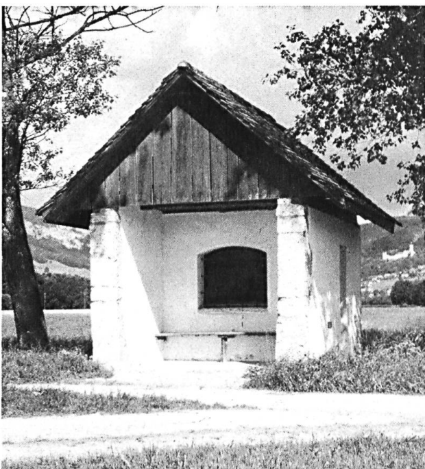
Wie diese Kapelle in Kestenholz (Zahnwehchappeli) soll die Germanskapelle ausgesehen haben.