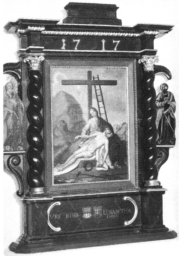
Das Barockaltärchen (eigentlich ist es ein Altaraufsatz) vor und nach der Restaurierung. Höhe 130 cm.

halb auf dem Altar nur Ross und nicht Henziross steht, ist nicht zu klären.