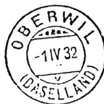
Stempelabdrücke der Post Oberwil 1932.