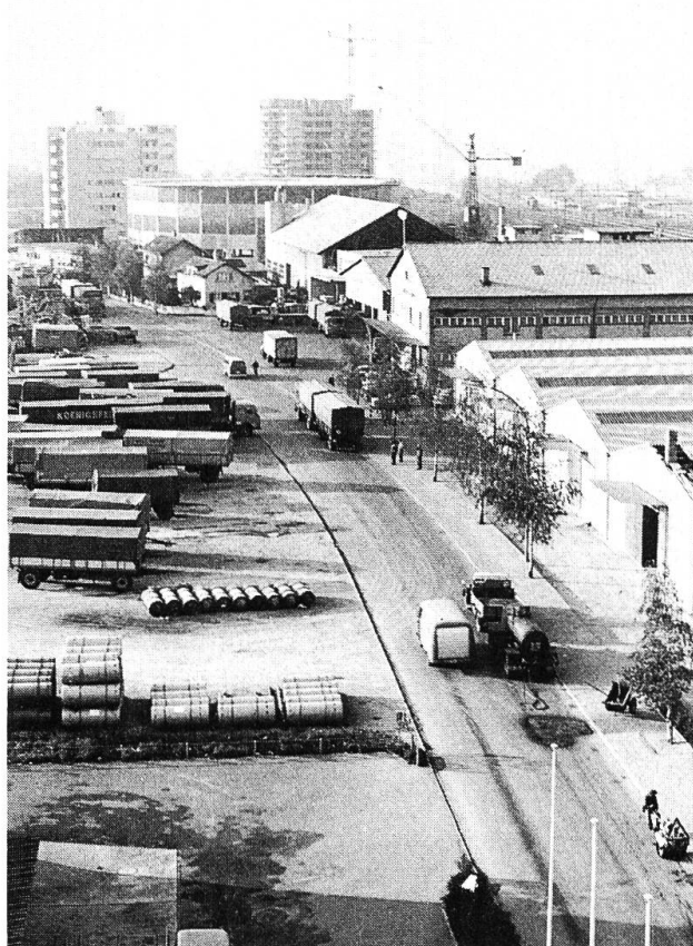
Das Industriequartier Hofacker hat Anschluss an Autobahn und Eisenbahn.

Ermöglicht hat dies vor allem der Umstand, dass die Hauptverkehrsziige (Strassen, Eisenbahn, Rhein) vom alten Dorfkern entfernt liegen und damit die räumliche Trennung von Wohnquartieren und Industriezonen begünstigten. In den Jahren 1919–1921 entstand an der Grenze zu Basel die Genossenschaftssiedlung Freidorf mit 150 Reihenhäusern und Gärten. Um die gleiche Zeit begann mit dem Bau eines der grössten Rangierbahnhöfe der Schweiz die Ansiedlung von Gewerben und Industrien sowie der Bau der kantonalen Rheinhafenanlagen in der Au. Am Rande dieser Zonen entstanden südwärts Wohnquartiere mit Wohnblöcken und Hochhäusern, während um den Dorfkern herum und am Hang des Wartensbergs vorwiegend Einfamilienhäuser erstellt wurden.