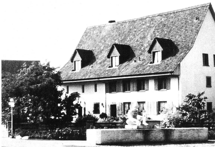
Dorfpartie in Riburg mit dem Narrenbrunnen.

des Reisens zum auswärtigen Arbeitsort müde wurde und nach der Ansiedlung von Industrie am Ort rief, hat man eine Industriezone ausgeschieden und sie erschlossen (auch mit Bahngeleisen). Zahlreiche Industriebetriebe verschiedenster Branchen haben sich seither niedergelassen und dazu beigetragen, dass Möhlin heute gegen 2700 Arbeitsplätze aufweist. Weil aber trotz der Nähe dieser Arbeitsplätze immer noch viele Leute ihr Brot in der Region Basel-Pratteln verdienen, kommen täglich auch viele Leute von auswärts in unsere Gemeinde (z. T. aus dem Elsass und dem süddeutschen Raum).