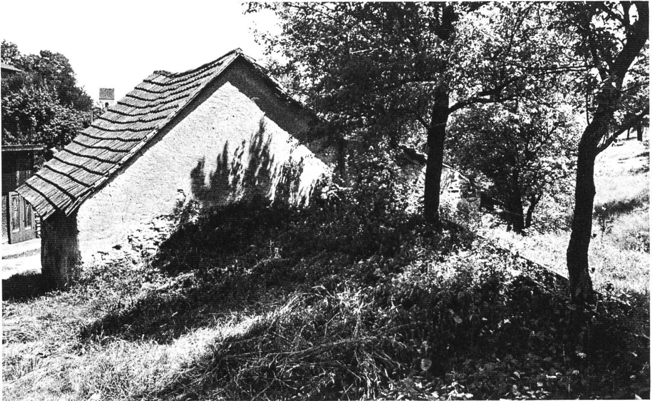
8 Rückseite der unteren Mühle

vorher von Spreu und Unkräutern gesäuberte Korn wird in der Schrotmühle in 2–3 Mahlgängen zu feinem Vollkorngrüss gebrochen. Das Aussieben, d. h. das Separieren des feinen Mehles vom Schrot und von der Kleie fällt weg, da Vollkorngrüss alle Bestandteile enthält.