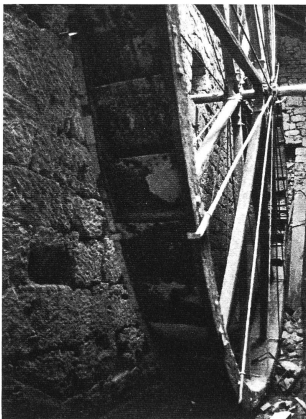
6 Wasserrad (vor der Restaurierung)