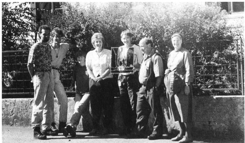
Übergabe der Glasscheibe in Rickenbach vor dem ehe- maligen Kinderheim.

Der Anlass bot willkommene Gelegenheit, den Kindern des Kinderheims Bachtelen Landschaften und Geschichte des Kantons Solothurn näherzubringen. R. W. Walther