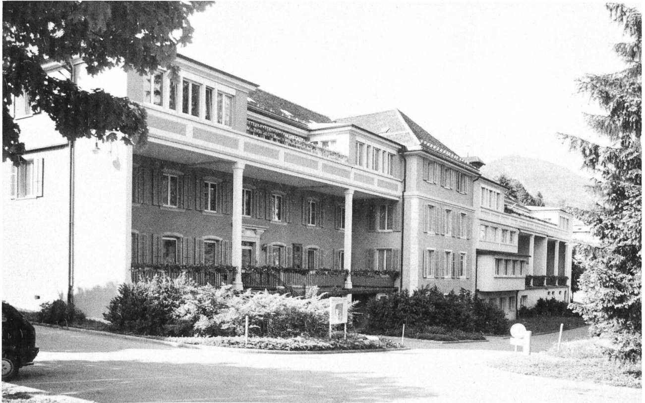
Hauptgebäude des Kinderheims Bachtelen, genannt Girardhaus, heute, nach diversen Anbauten und Renovationen.

aus einer ganz persönlichen Betroffenheit heraus, ohne dass ihr individuelles Empfinden von der Gesellschaft mitgetragen werden konnte. Dieses menschlich-emotionale Handeln bildete während Jahrzehnten die Grundlage der Entwicklung unserer Institution. Damit ein umfassendes Umdenken und damit verbunden ein Neuhandeln Platz greifen konnten, mussten die geistigen Folgen der Kriegszeit und der daran anschließenden «Idylle des Wirtschaftswunders» überwunden werden. Die Anliegen der im Kinderheim betreuten Kinder mussten von der Gesellschaft als berechtigt und im Sinne einer ganzheitlichen Erziehungsauffassung anerkannt und als allgemeine Aufgabe aller wahrgenommen werden.