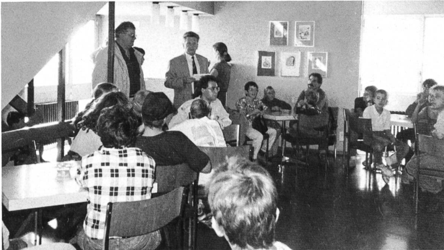
Übergabe der Glasscheibe im Stadthaus Olten.