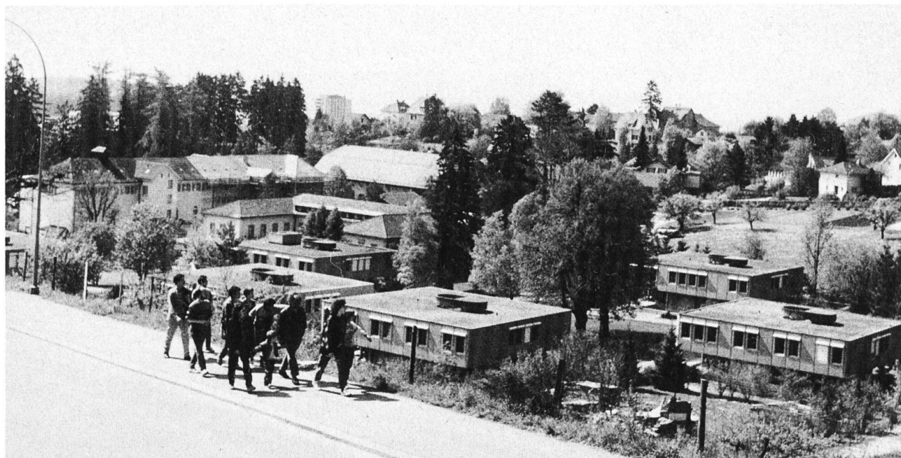
Die heutigen Anlagen des Kinderheims Bachtelen mit den Altbauten und den Neubauten.

Es wäre unvollständig berichtet, wenn wir uns ausschliesslich auf pädagogische Entwicklung beschränkten. Recht eigentlich mit der Umbenennung der Institution im Jahre 1979 und dem Einweihungsfest setzte die kulturelle Arbeit des Kinderheims und seiner Mitarbeiter ein. Mit der denkmalpflegerisch verstandenen Sanierung der Altbauten einerseits, mit den Bachtelen-Matinées andererseits wurde diese Seite des Bachtelen gepflegt. Und wenn am 17. November 1991 die Mazzini-Gedenkstätte eröffnet wird, erhält die Stadt Grenchen und mit ihr der Kanton Solothurn einen weiteren, wesentlichen Kristallisationspunkt.