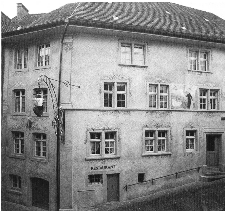
Eckhaus Taverne und Museum «Schiff» mit klassizistischem Wirtshausschild, Grisaille-Malereien an den Fenstereinfassungen, Wandbild (Erweckung eines ertrunkenen Kindes) und kleines Medaillon mit dem heiligen Fridolin.

In der Geschichte des alten Laufener Eckhauses zum Schiff, das 1805 durch Zusammenlegung von zwei im Kern mittelalterlichen Häusern entstanden war, brachte des Jahr 1979 den Beginn einer neuen, glücklichen und hoffentlich lange dauernden Ära. Im Jahre zuvor war der Museumsverein Laufenburg gegründet worden mit dem Zweck, zur Verbreitung der Kenntnisse über die Geschichte Laufens und seiner weiteren Region beizutragen sowie erhaltenswerte Dokumente aller Art aus der Natur-, Sozial-, Wirtschafts- und Kulturgeschichte zu sammeln, zu bewahren und der Öffentlichkeit zugänglich zu machen. Dieser Verein erwarb das Haus, restaurierte es und richtete darin das Museum, dazu eine Gaststätte mit neuer Zunftstube der Narro-Alt-Fischerzunft und Räumen für die Migros-Klubschule ein. Gleichzeitig wurde aus dem