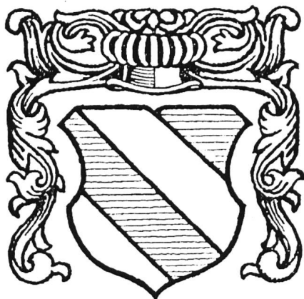
Wappen Hessos von Grenchen. Dreimal schräg rechts geteilt, mit den Farben Silber und Blau.

Als am 17. Dezember 1940 die Gemeindeversammlung die heute gültige Form des Gemeindewappens genau festlegte, war dieses Wappen, in unterschiedlichen Detailausführungen, schon seit 40 Jahren in Gebrauch: Auf Briefköpfen und Stempeln. Um 1900 herum scheint das Bedürfnis aufgekommen zu sein, unsere stark wachsende Industriegemeinde mit einem Symbol auszuzeichnen, wie es seit alters her die Städte besaßen. (Die meisten Schweizer Gemeinden suchten wohl erst für den Höhenweg der Landesausstellung 1939 ihr Wappen.) In Erinnerung an die überragende Bedeutung des einstigen Ackerbaus wählte man damals das Zeichen der Pflugschar, das erstmals 1640 am Sakramentshäuschen in der Kirche und dann 1692 auf Glocken der Kapelle von Allerheiligen dargestellt ist. Es ist zu vermuten, dass es sich bei der Pflugschar um ein Hauszeichen einer alten Grenchner Familie handelt, wie es zur Kennzeichnung von Geräten diente. Ein Familienwappen dürfte es kaum sein, denn solche besaßen damals nur die Patrizierfamilien der Stadt. Nun hätte aber gerade Grenchen um 1900 nicht weit suchen müssen, um ein Wappen zu finden. 1892 machte der Historiker Meisterhans den