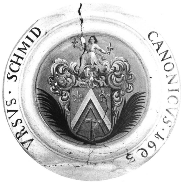
Wappen von Urs Schmid, Stadtpfarrer von Solothurn, Chorherr 1690, gest. 1694.