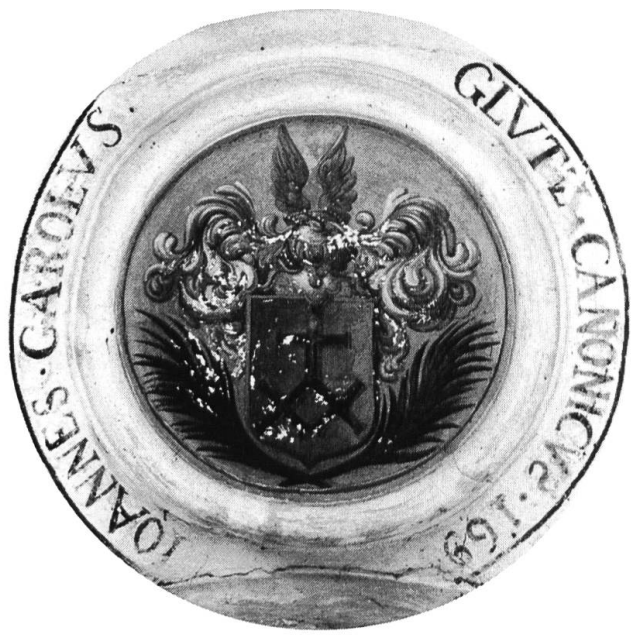
Wappen von Johann Karl Glutz, Chorherr 1687, Propst 1727, gest. 1735.

kristei zu verbannen, soll die Türe zu seinem «Hüttli» zugemauert werden.