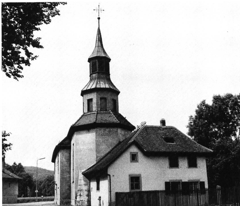
Die Dreibeinskreuzkapelle mit renoviertem Sigristenhaus, 1979.

Am 31. August 1993 wurde in bescheidenem Rahmen das 300-Jahr-Jubiläum der Dreibeinskreuzkirche begangen 1 . Die Geschichte dieses Gotteshauses ist noch nicht geschrieben und kann auch im Folgenden nicht vorgelegt werden; dazu wären weitere Forschungen und auch denkmalpflegerische Untersuchungen nötig. Aber ein Beitrag dazu soll damit geliefert werden: regestenartige, knappe Inhaltsangaben der diesbezüglichen Eintragungen in den Protokollen des St. Ursenstiftes . Diese werden im Staatsarchiv Solothurn verwahrt; eine Kartei mit einigen tausend Karten, nur chronologisch, nicht sachlich geordnet, erschliesst diese Protokolle.