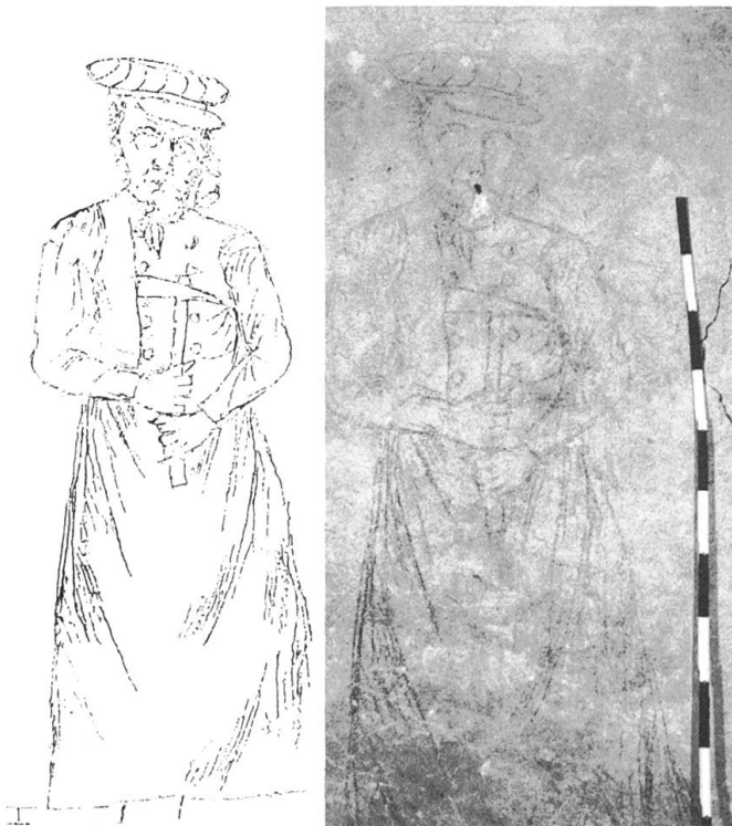
Lindenberg 1. Kohlezeichnung mit der Darstellung eines Zimmermanns an der Gangwand, 1. Hälfte 19. Jh.

Der schöne Gartensaal im Bäumlihof ist restauriert worden. Er wurde 1738 von Architekt Johann Hemeling errichtet; Johann Jakob Stehlin baute ihn 1865 im Zeitgeschmack nach französischem Vorbild mit Ballustern statt des Pyramidendaches um. Das Innere erhielt seinen festlichen Glanz zurück. Besonders auffallend ist die wiederhergestellte Fassade an der Gartenseite mit der mit rotem, grauem und beige Stuckmarmor verzierten, pilasterbesetzten Rückwand der gusseisernen Gartenlaube. Sie wurde mit grossem handwerklichen Geschick freigelegt, geflickt und wieder zum Klingen gebracht. Ein bescheidener, aber hübscher Fund gelang am Lindenberg 1 mit einer auf