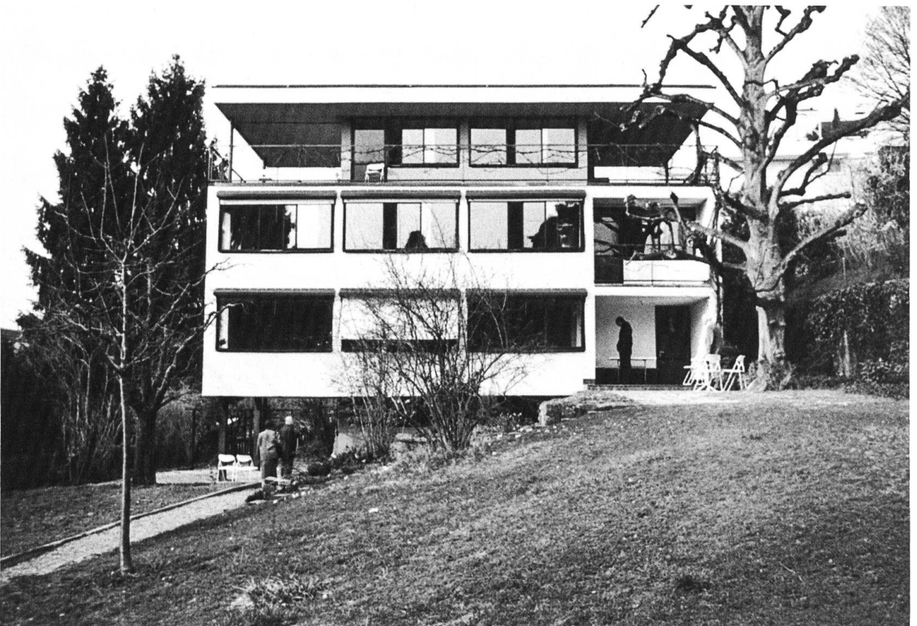
Riehen, Hackbergstrasse 29. Haus Schmidt 1929, renoviert durch Prof. Benedikt Huber.