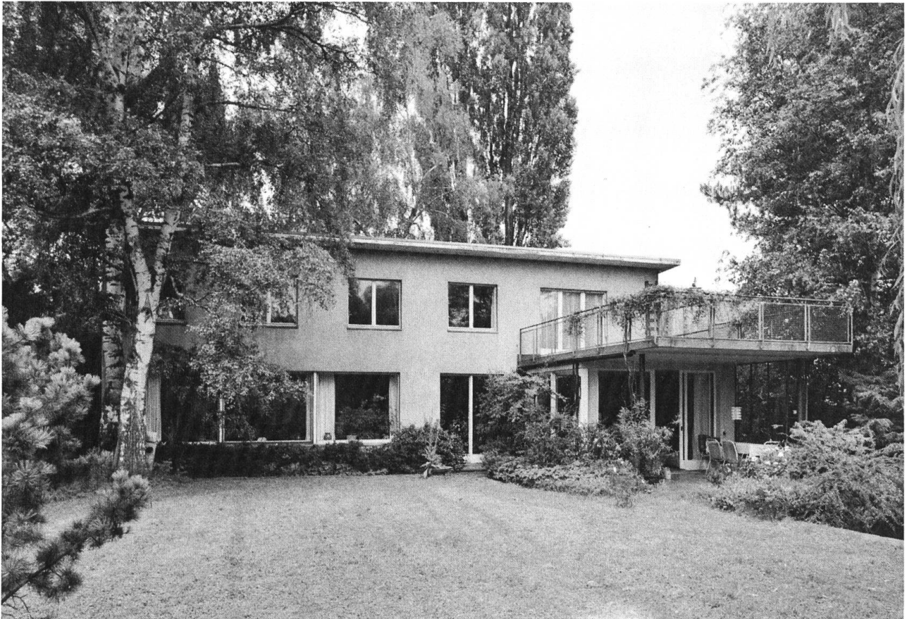
Peter Ochs-Strasse 3. Wohnhaus des Architekten Hermann Baur, 1934.