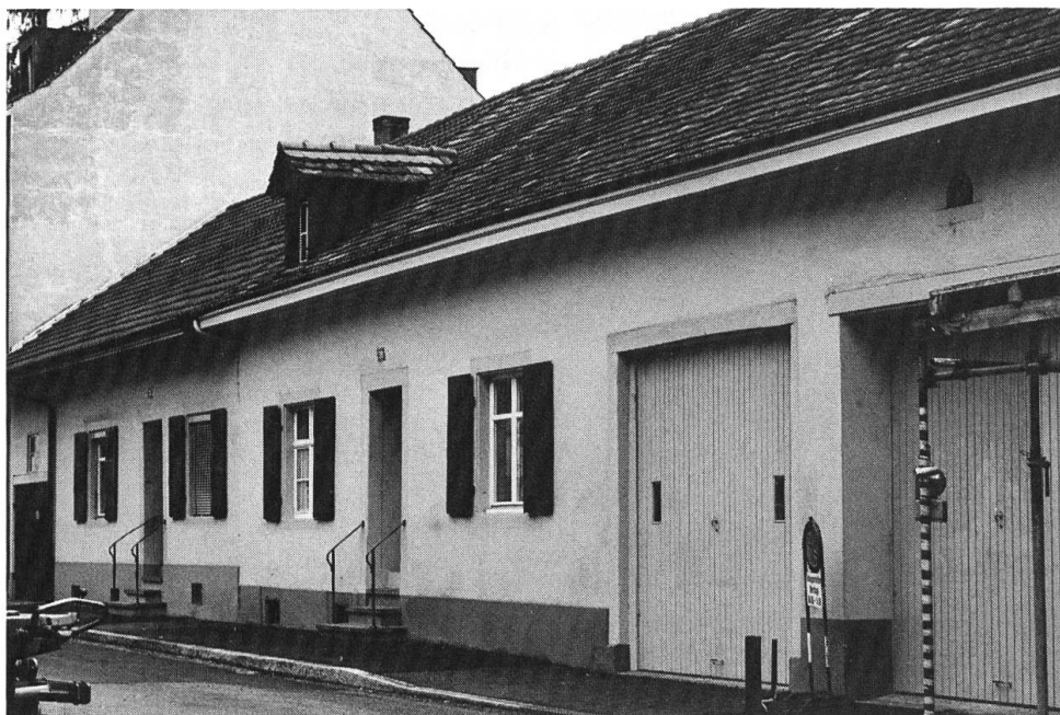
Riehen, Schützengasse 30. Tagelöhnerhaus von 1862.

Grundlagen in Basel angemessener interpretieren können. Im Grunde genommen ist – um an den Anfang dieses Aufsatzes zurückzukehren – auch in Basel die heutige Denkmalpflege erst durch den vom Jahr für Heimatschutz und Denkmalpflege heraufgerufenen Geist möglich geworden, obwohl hier schon lange vorher an einem Gesetz gearbeitet und Denkmalpflege unter widrigen Umständen betrieben worden war.