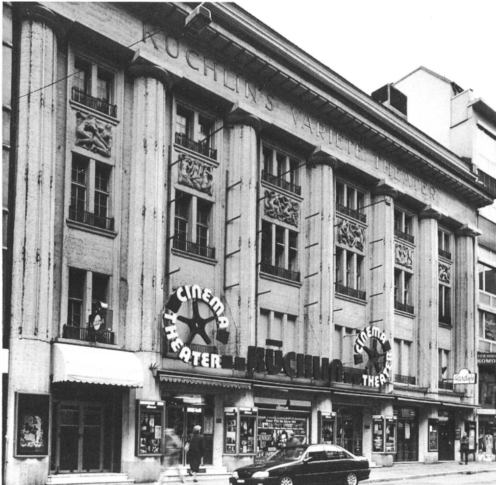
Küchlintheater Steinen- vorstadt, erbaut 1912.

die Wand mit Kohle gezeichneten mannsgrossen Darstellung eines Handwerkers. Das Haus gehörte bis 1825 einem Zimmermeister, der es als Holzlager verwendete. Die Schürze, die Mütze, die geknöpfte Jacke, die Pfeife im Mund und das Werkzeug versetzen uns in die biedermeierliche Zeit