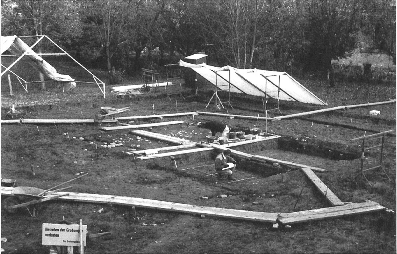
Gesamtansicht der Ausgrabungen im Herbst 1992.

sen. Nur noch an einzelnen Stellen waren Spuren von gestampften Lehmböden zu erkennen. Verbrannte Lehmbrocken mit Rutenabdrücken, sogenannter «Hüttenlehm», zeigen uns, dass die Hauswände aus einem Rutengeflecht bestanden, das mit Lehm ausgestrichen wurde. Sämtliche Balkenreste waren verkohlt, das Gebäude muss also einem Brand zum Opfer gefallen sein. Leider gelang es nicht, Proben aus diesen Balken mit der Jahrringmethode zu datieren, so dass wir für die Altersbestimmung auf das Fundmaterial angewiesen sind. Demnach dürfte die Besiedlung etwa um 1200 eingesetzt haben, im Laufe des 14. Jahrhunderts brach sie wieder ab. Diese archäologische Datierung wird durch die historische Überlieferung, Altreu sei im Guglerkrieg von 1375 zerstört worden, unterstützt.