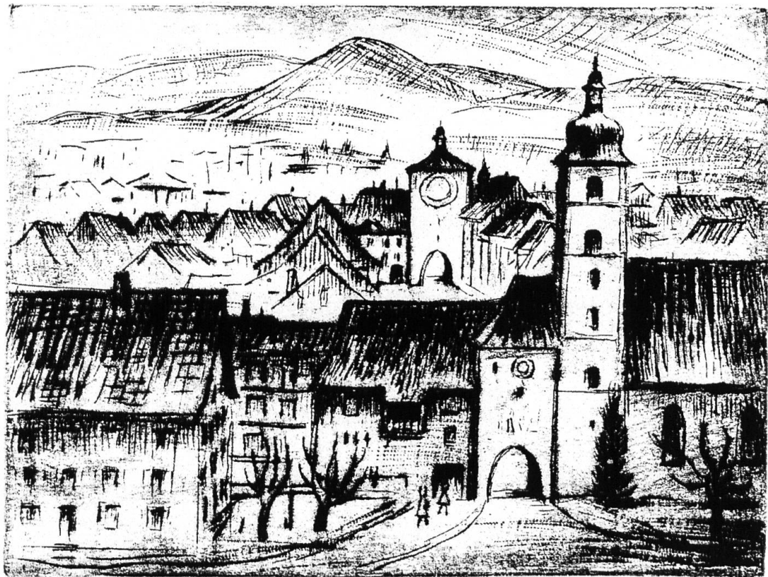
EA 3/4 "Laufen" S. Borer 1982