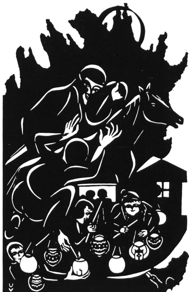
St. Martinstag in Laufen.

Geschichte wird bekanntlich jeden Tag neu geschrieben. Das 700-Jahr-Jubiläum der Stadt Laufen ist sicher einen Stundenhalt wert. Dabei mag sich der eine oder andere beim Rückblick auf die wechselvolle Vergangenheit fragen: War es Zufall oder Fügung, dass sich die Laufentaler im Jahre 1989 just zu Martini für einen Wechsel der kantonalen Herrschaft entschieden?