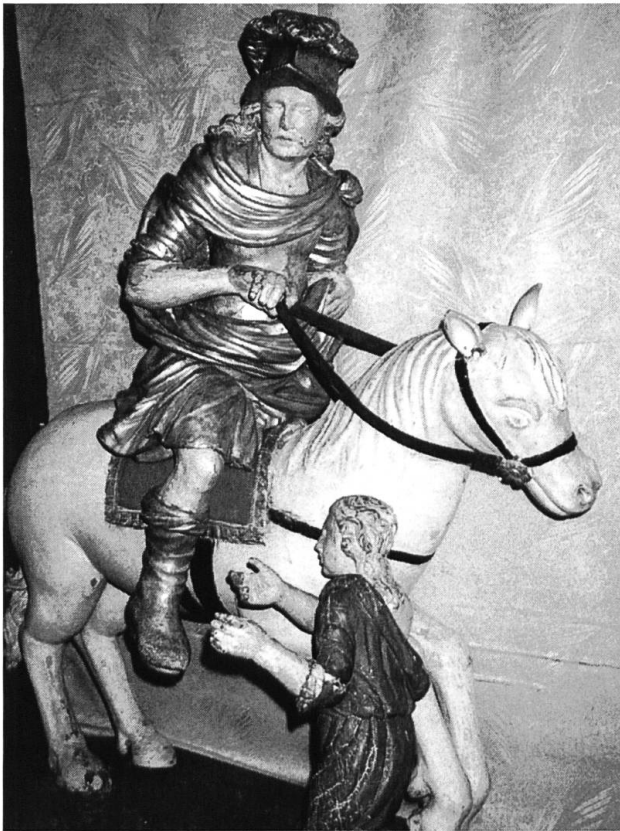
St. Martin. Reiterstatue im Laufentaler Museum in Laufen.

700 Jahre Stadtrecht Laufen. Es spricht für das Selbstbewusstsein der Bürger einer Kleinstadt, dass sie die Übergabe des Freiheitsbriefes für ihr Gemeinwesen als Jubiläum feiern. Dabei hätte Laufen schon vier Jahre zuvor Gleiches tun können; damals waren 850 Jahre seit seiner ersten urkundlichen Erwähnung vergangen. Am 10. April 1141 hatte die Kirche von Basel in einem Vergleich auf ihre Rechte am Kloster St. Blasien im Schwarzwald verzichtet und statt dessen u. a. die «Curtis Loufen», bis anhin Reichslehen desselbigen Klosters, erhalten. Der Hof umfasste die Gebiete der heutigen Gemeindebänne von Laufen, Röschenz, Wahlen und Zwingen. Wie das erwähnte Kloster zu Besitztum im Birstal gekommen war, blieb bis heute im Dunkeln.