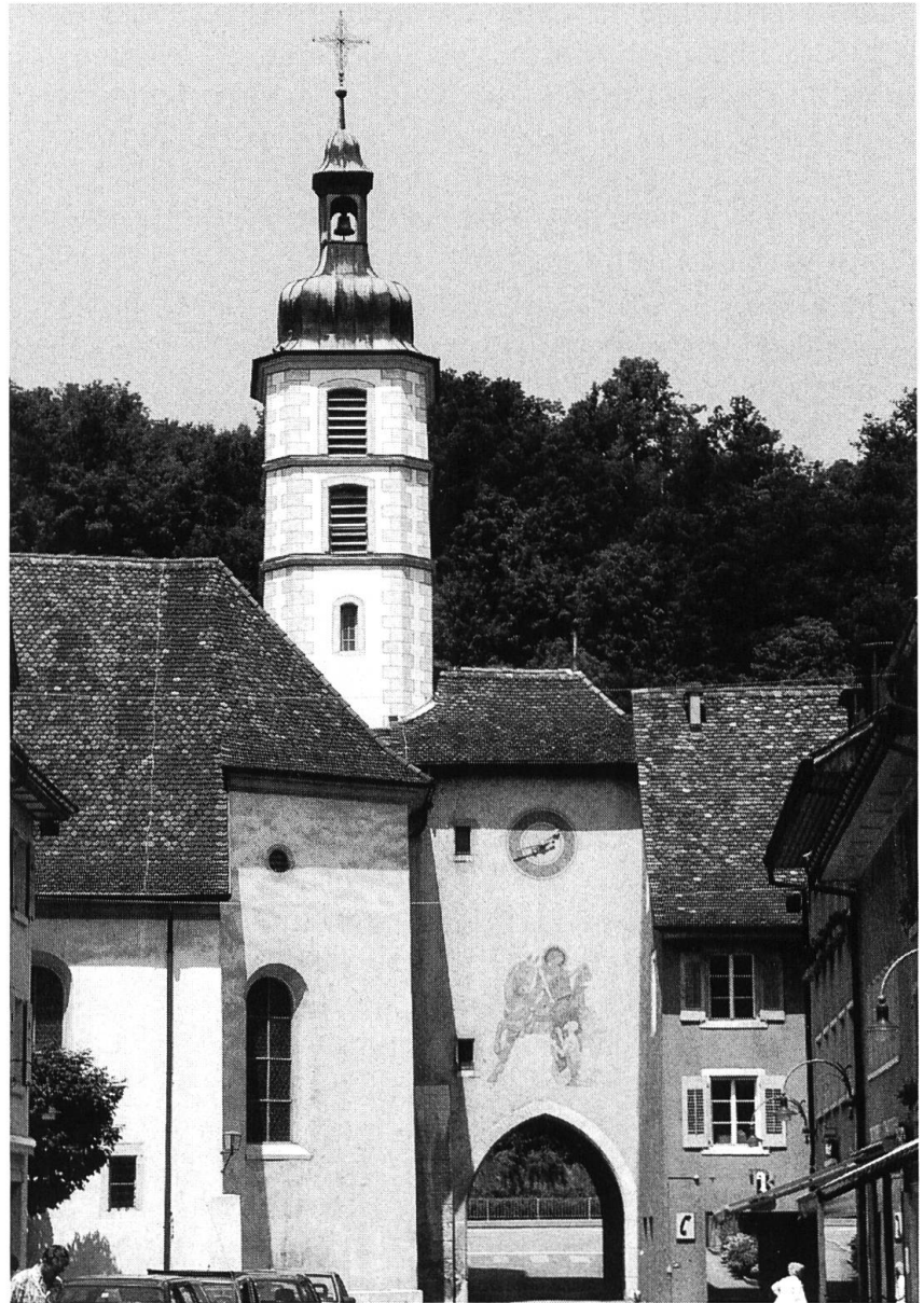
Das Unter- oder Basler-Tor.

liche Glocken aus den Türmen herunterzunehmen. Gerne hätten die Laufner je eine Glocke von St. Martin als auch von St. Katharinen behalten. Aber nur eine wurde ihnen von der «Grande Nation» gestattet und so blieb nur «die Glocken hinunter zu thun und die von der Nation gebliebene anders zu hencken aus der Pfarrkirchen (St. Martin) in der St. Catharinenkirche». Diese – für die Laufentaler wiederum äusserst schwere – Zeit beinhaltete nebst dem Kampf gegen die Kirche den Verkauf der «Nationalgüter». So wurde auch die alte St. Martinskirche veräussert und dann als Steinbruch benützt. Heute erinnert nur noch die Statue des Hl. Martin (Kopie) an der – im Jahre 1809 auf Fundamenten des