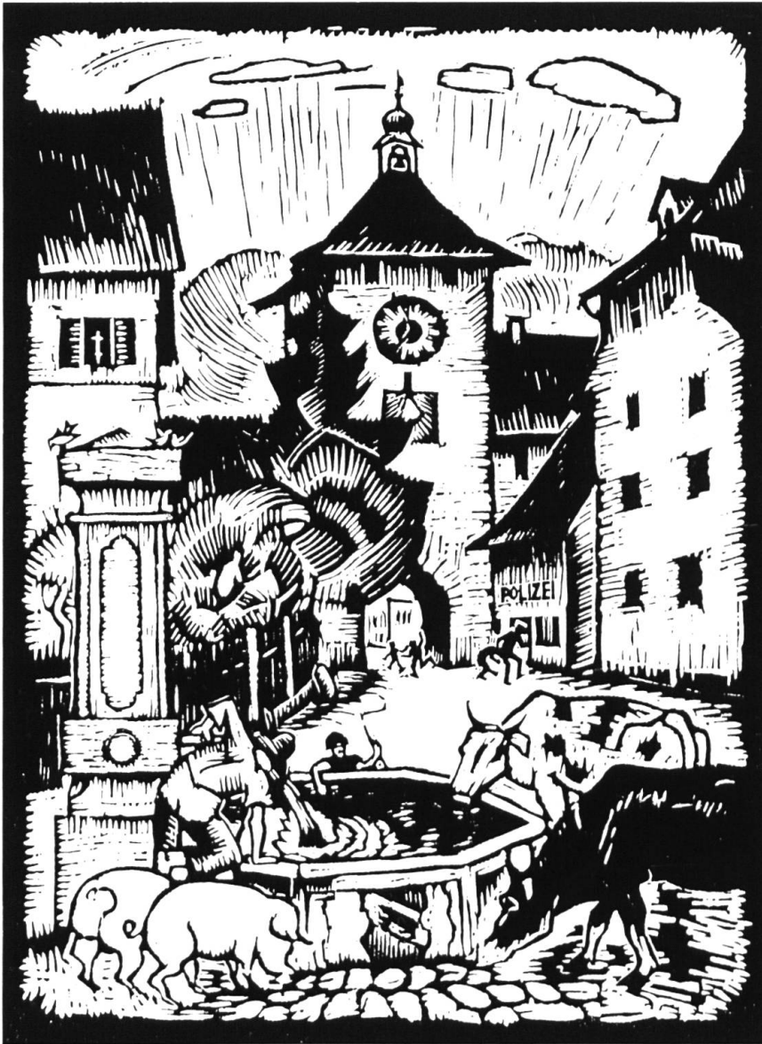
Laufen Obertor mit Vorstadt- Brunnen. Links am Rand das alte Feningerspital. Der Brunnen besteht heute nicht mehr. Holzschnitt von August Cueni.

hunderts die Gründung der Stadt Laufen erfolgte, wurde gegenüber dem «Dorff zu Loffen ennet der Birs» ein Gebiet aus dem Dinghof ausgesondert und z. T. verselbständigt. Talkirche St. Martin, Dinghof und Stadt Laufen sind untrennbar mit der wechselvollen Geschichte des Laufentals verbunden.