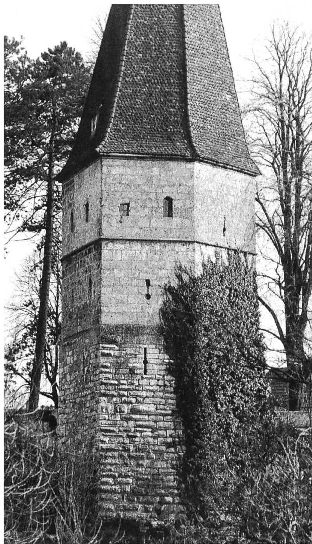
Solothurn, Krummturm: Ähnlich wie das Bieltor entstammen auch die bossierten Untergeschosse des Krummturmes aus Kalkstein dem 13. Jahrhundert und die glatten Tuffsteinobergeschosse dem 15. Jahrhundert, genauer der Zeit um 1462/63.

schränktes Vorkommen, andererseits dessen vielfältige und praktische Verwendungsmöglichkeiten.