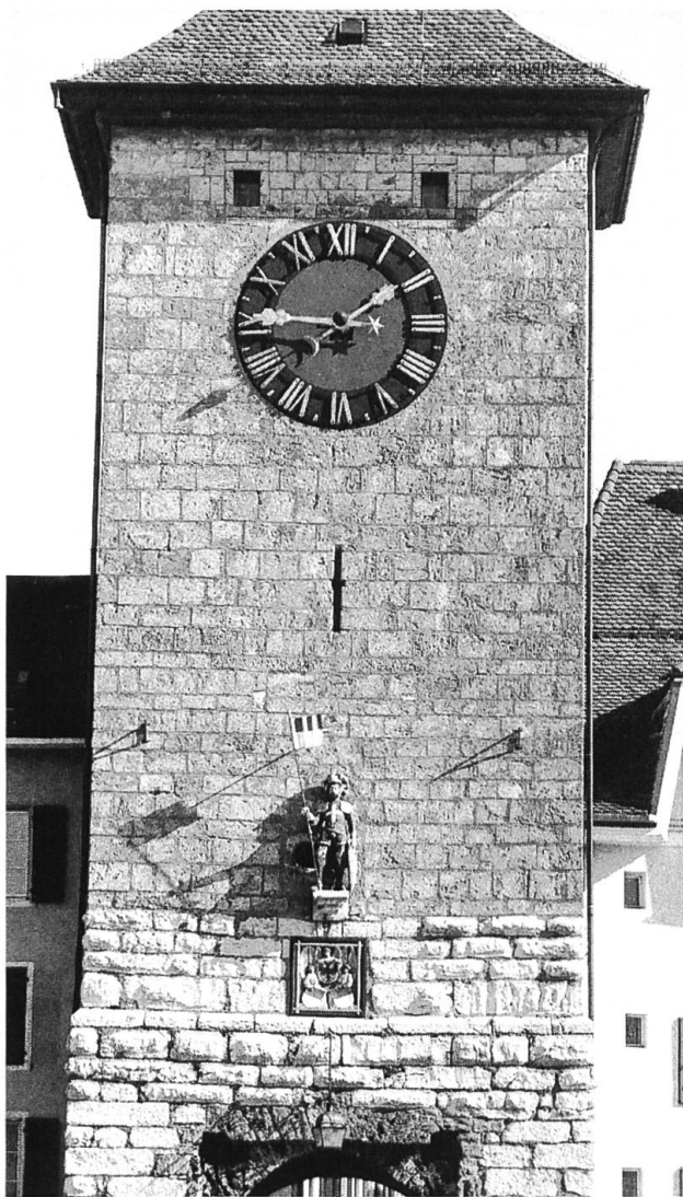
Solothurn, Bieltor: Die Untergeschosse im hellen Solothurner Kalkstein entstammen dem frühen 13. Jahrhundert. Die vier darüberliegenden Geschosse oberhalb der St. Ursenfigur sind aus glatten Tuffsteinquadern gefügt und dürften im späten 14. oder im frühen 15. Jahrhundert aufgeführt worden sein.