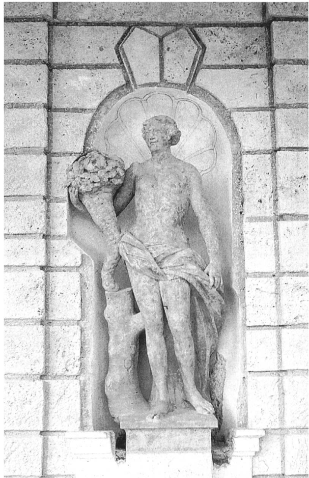
Feldbrunnen-St.Niklaus, Schloss Waldegg: Ausschnitt aus der Tuffsteingrotte des östlichen Seitenflügels mit Figurenallegorie des «Frühlings» aus Kalkstein von Johann Peter Frölicher (um 1685). Bei diesem barocken Beispiel ist das Material Tuff nicht mehr aus praktischen Gründen, sondern aus architekturikonologischen Gründen gewählt worden: Der aus der Wasserquelle entstandene Tuff wurde auf der Waldegg ganz bewusst in den Zusammenhang mit Grotte und Brunnen gestellt. Daneben bilden die Grotten in den beiden Schlossflügeln auch seltene Beispiele von künstlich imitiertem (nämlich mit Hilfe von Nagelbrettern aus Kalk strukturiertem) Tuff, der allerdings in dieser Aufnahme vor Vollendung der Restaurierungsarbeiten nicht erkennbar ist.

Schon aus diesen wenigen Schriftquellen ersehen wir wie vielseitig die Verwendungs-