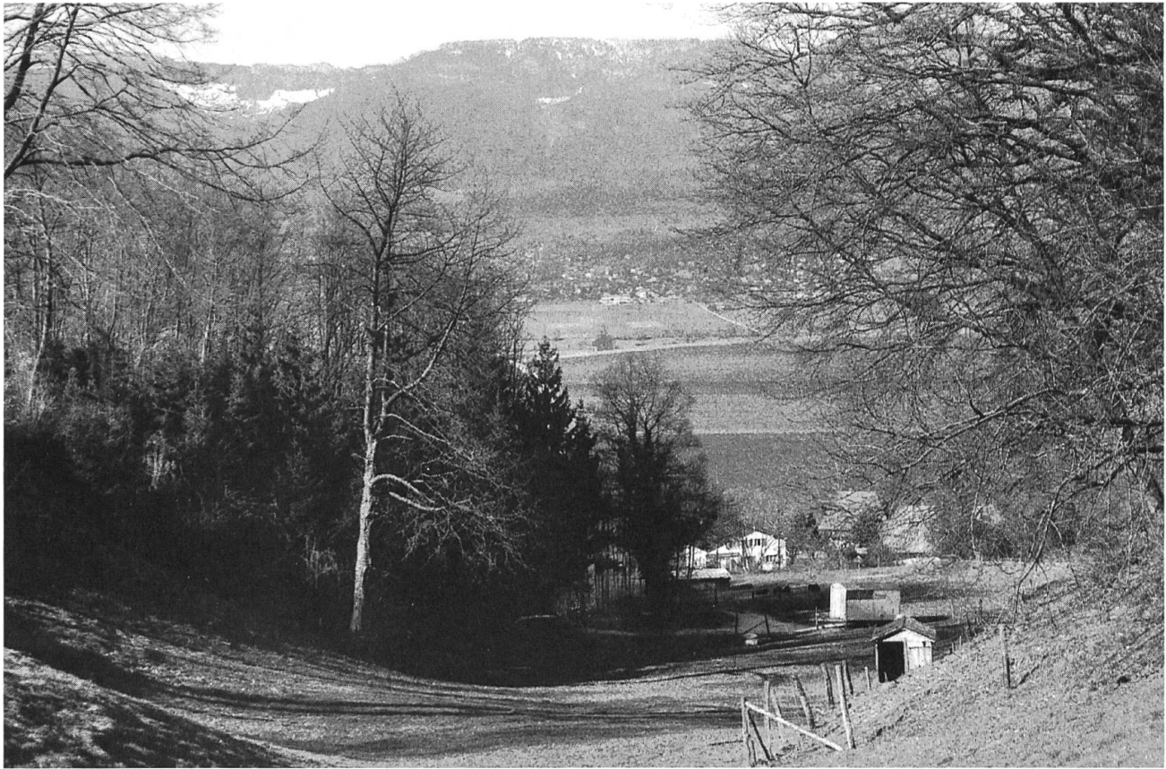
Leuzigen BE: Blick über die ehemaligen Leuziger Tuffgruben nach Norden. Im Bildmittelgrund ist der Aarelauf erkennbar, der für die Verschiffung der Leuziger Tuffvorkommen nach Solothurn von Wichtigkeit war.

Luftlinie Entfernung fanden sich ideale Möglichkeiten für den Steintransport auf dem Wasserweg nach Solothurn. Natürlich kann man davon ausgehen, dass auch der Tuffstein von Pieterlen, von Grenchen und von Bettlach auf Schiffen hertransportiert wurde: Für alle diese Gruben sind Tufftransporte auf der Aare verbürgt, teilweise schon im 15. Jahrhundert. Gar die Besorgung von Transportschiffen für Leuziger Tuff ist archivalisch verbürgt. Aber im Falle von Leuzigen sind auch Transporte zu Land nachgewiesen, die entweder von der Stadtfuhr oder durch das Gericht Lüsslingen zu bewerkstelligen waren.