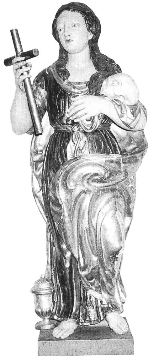
Zwei Statuen in der St. Jostkapelle, Klus Oensingen: links: St. Jost, rechts: St. Maria Magdalena.