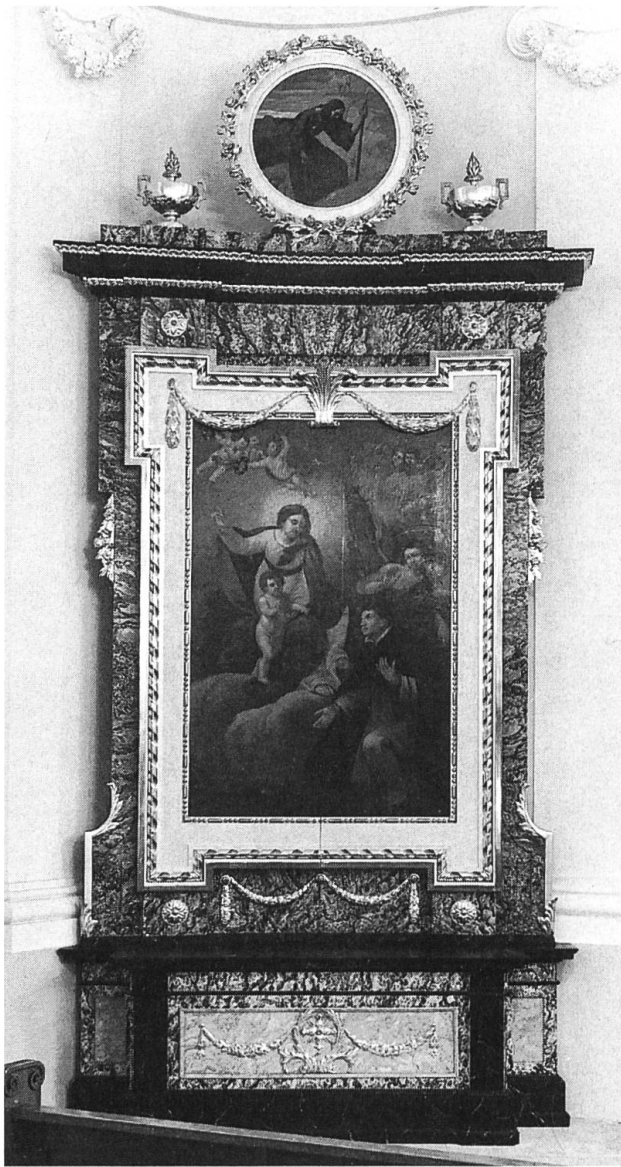
Linker Seitenaltar in der St. Eusebiuskirche Grenchen.