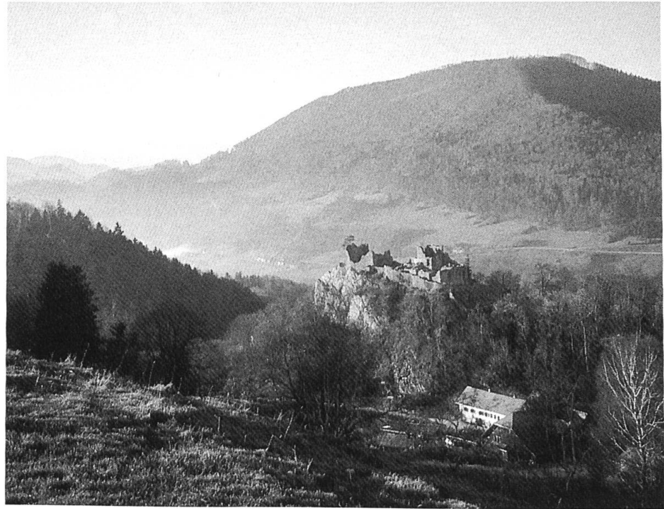
Blick von der Schlosshöchi zur Ruine Alt Bechburg Richtung Holderbank.

Warum der Übergang Egg der nur 500 m entfernten und 28 m niedrigeren Wishöchi vorgezogen wurde, ist schwerlich auszumachen. Der letzte Anstieg von Süden und Punkt 773 her ist bei der Egg etwas weniger steil als der Hohlweg zur Wishöchi . Auf der Nordflanke indessen sind die Verhältnisse ähnlich. Der Abstieg von Egg führte durch das Schneckenholz zum Untern Schlossgut, heute Gasthof Bechburg, und von da geradlinig zum Augstbach hinunter, um dann bei Lochhus in der Nähe der Kantonsgrenze in die Hauensteinstrasse zu münden.