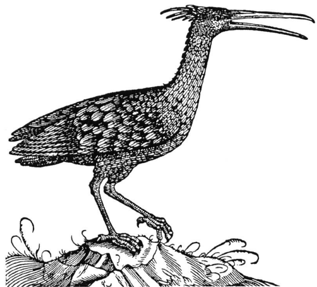
Der Waldrapp, Geronticus eremita (L.), aus Conrad Gessner (1581)