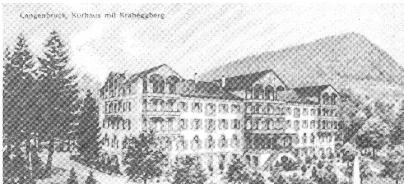
Kurhaus Langenbruck, Fassade gegen Süden (Postkarte, idealisierte Darstellung, wohl vor 1914. Film von der Schul- und Büromaterialverwaltung Liestal).

Armut war nun nicht mehr zu übersehen; die Posamenterei sollte mehr Verdienst bringen, in den 1850er Jahren wurde auch die Uhrmacherei eingeführt – beides mit mässigem Erfolg. Mehr brachte die Entwicklung des Fremdenverkehrs, wofür vielfältige Anstrengungen unternommen wurden. Entscheidend wurde die bessere Erschliessung durch die Schmalspurbahn Liestal-Waldenburg, 1880 endlich eröffnet; ihrem Bau und den Projekten für eine Verlängerung bis Langenbruck gelten detaillierte Ausführungen. Einlässlich wird die Wandlung zum Kurort dargestellt und nach Motiven, Interessen, Methoden und Umständen gefragt. Vorläufer der Kurgäste waren die Basler auf ihren Sennhöfen; zwischen Land- und Kuraufenthalt waren aber doch deutliche Unterschiede festzustellen. Die GG betrieb intensive «Ortsverschönerung», was einer städtischen Sehweise entspricht und Natur mit Komfort zu verbinden sucht; dabei wird die Verbindung mit Privatinteressen deutlich. Das Angebot an Privatlogis überwog vor 1874 deutlich, ihre Qualität war recht unterschiedlich; ein eigentlicher Kurbetrieb installierte sich früh im Sennhof «Kilchzimmer». Die Verdienstmöglichkeiten waren willkommen und jedenfalls lohnend.