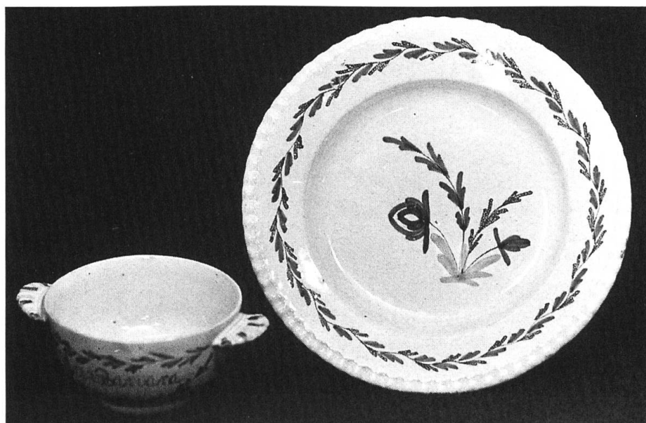
3 Schuppenrandteller mit Ohrentasse in Biedermeier. Fayence mit Zinnglasur, polychrom bemalt. Aufschrift: Vorderseite «Ana Barbara», Rückseite «Meister 1817».

dieser Ausstellung. Die Formen und Blumenmotive verschiedenster Manufakturen ähneln sich so sehr, dass die Zuschreibung seit über 50 Jahren immer wieder heftige Kontroversen auslöst. Schön sind aber die bis heute erhaltenen Zierteller, Suppenschüsseln, Terrinen und Bartschalen so oder so, und die Betrachter sind auch heute noch entzückt von der Feinheit des Scherbens und der Malerei im 19. Jahrhundert. Schon die Herstellung des Tellers, der Ohrentasse oder des Tintengeschirrs aus gewöhnlicher Töpfererde ist ein Kunstwerk. Die Malereien mit Metalloxid-Farben in die noch ungebrannte Zinnglasur geben den Formstücken dann aber eine vornehme Schönheit, die die Fayence vom gewöhnlichen Essgeschirr abhebt (Bild Nr. 4).