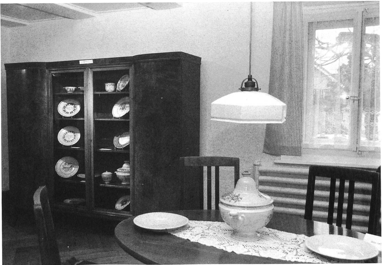
7 Wohnstube mit dem Sonntagsgeschirr des 19. Jahrhunderts.