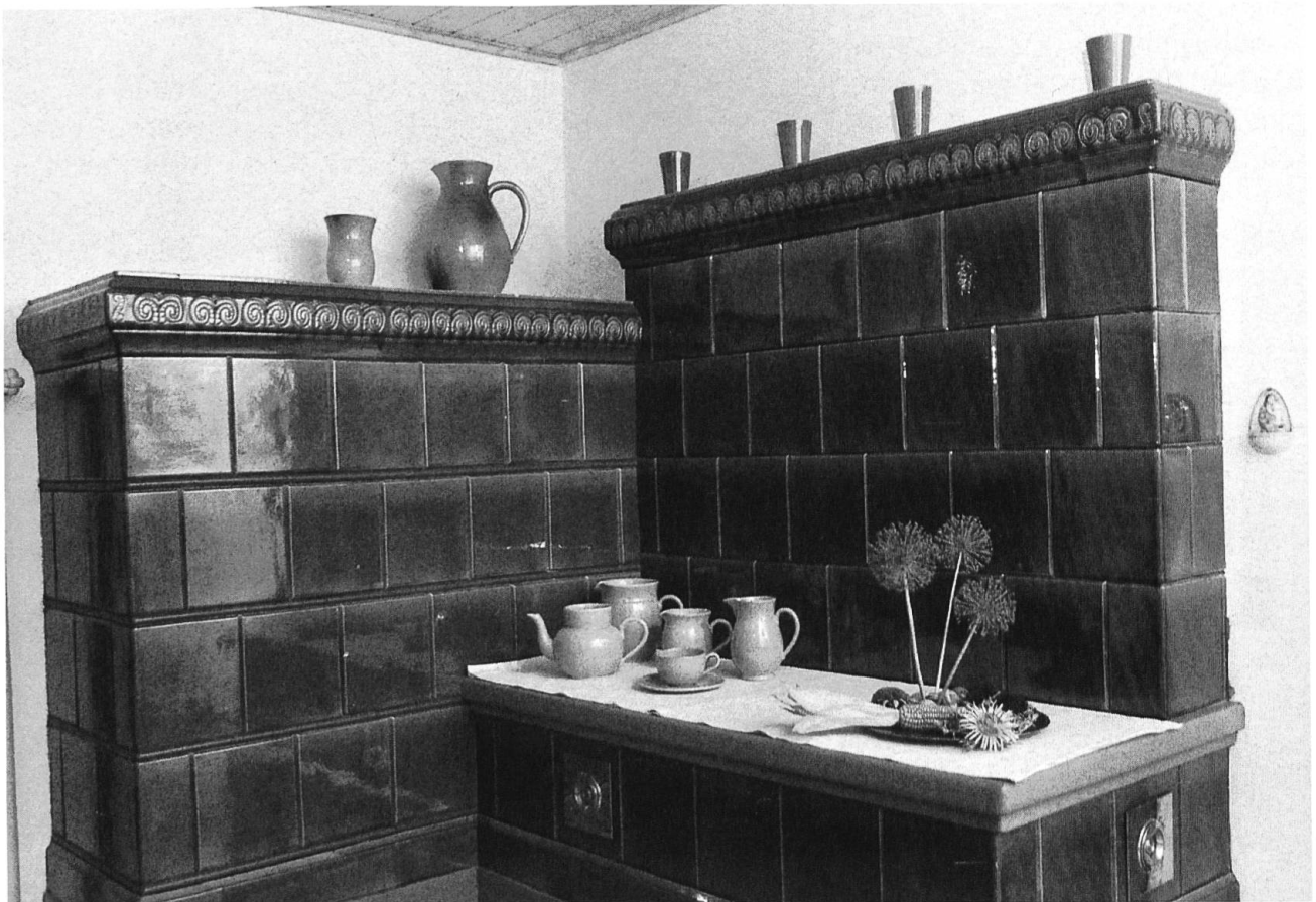
8 Kachelofen mit Gebrauchsgeschirr aus den 50er Jahren.