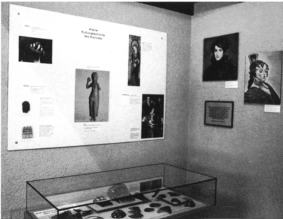
Der Kamm in der Kulturgeschichte.