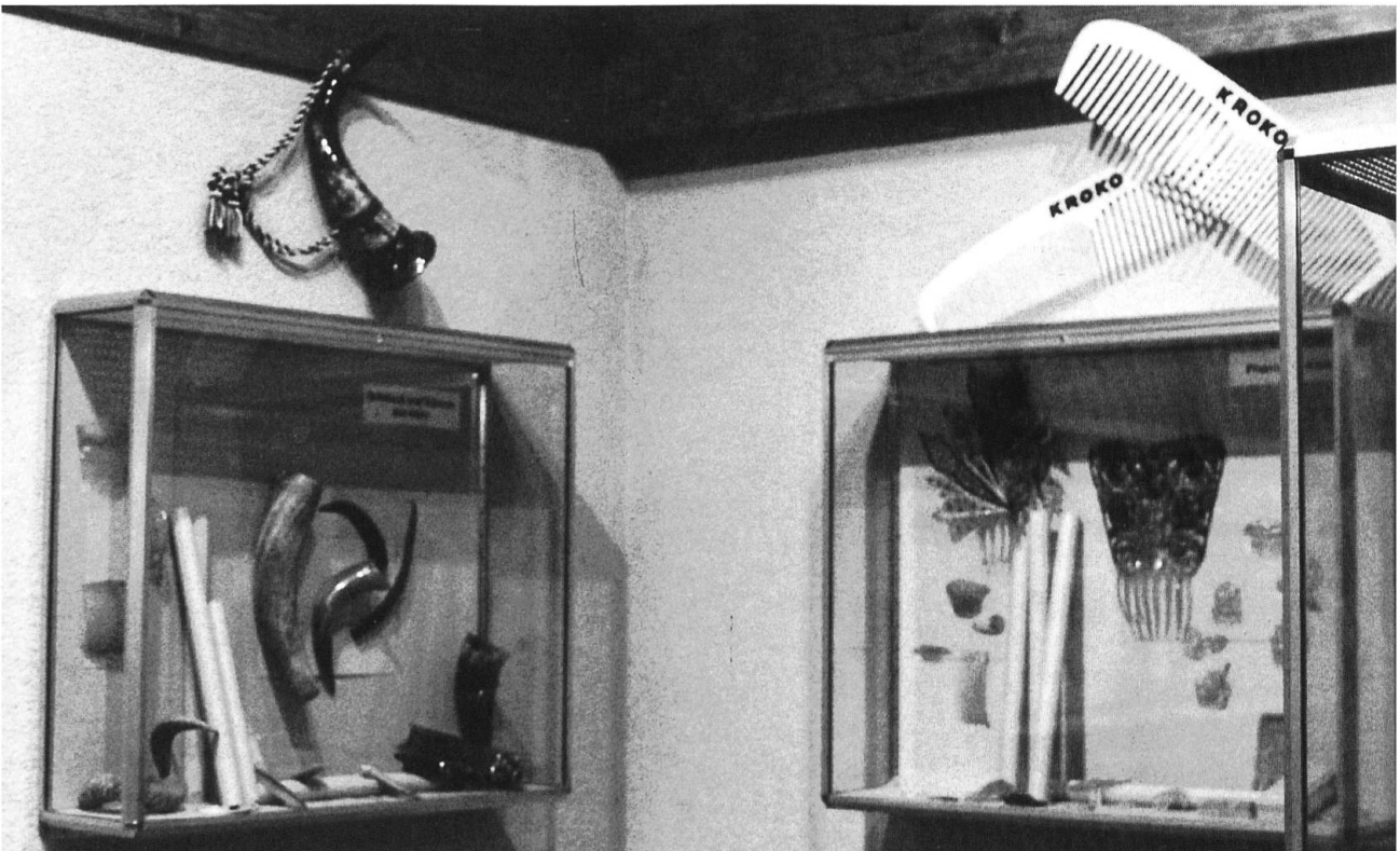
Schmuck- und Fantasiekämme aus Horn und Kunststoff.

gesammelt, um wieder verwendet zu werden. Wahrscheinlich entstand beim Polieren ein Funke, der durch die Absaugvorrichtung in den Behälter im Keller gelangte und dort den sehr leicht entzündlichen Zelluloid-Staub zur Explosion brachte. Durch diese Explosion wurde der Boden des Erdgeschosses gehoben. Die ins Freie führen-