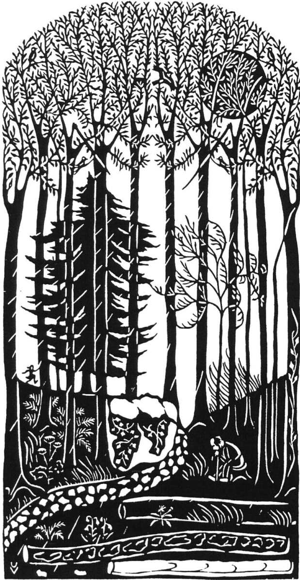
Im Atem der Zeit