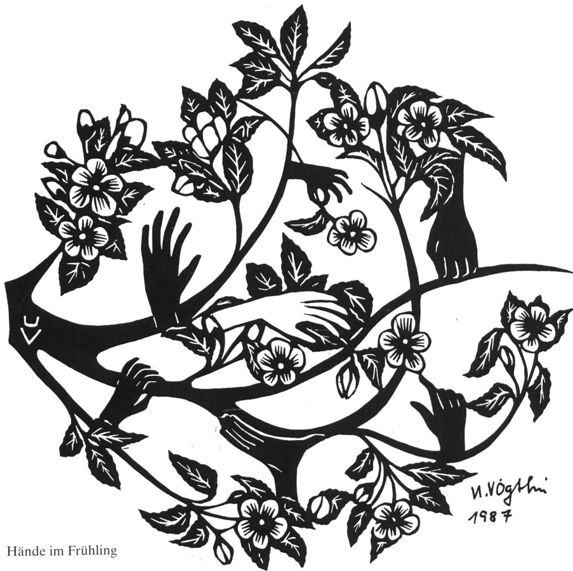
Hände im Frühling