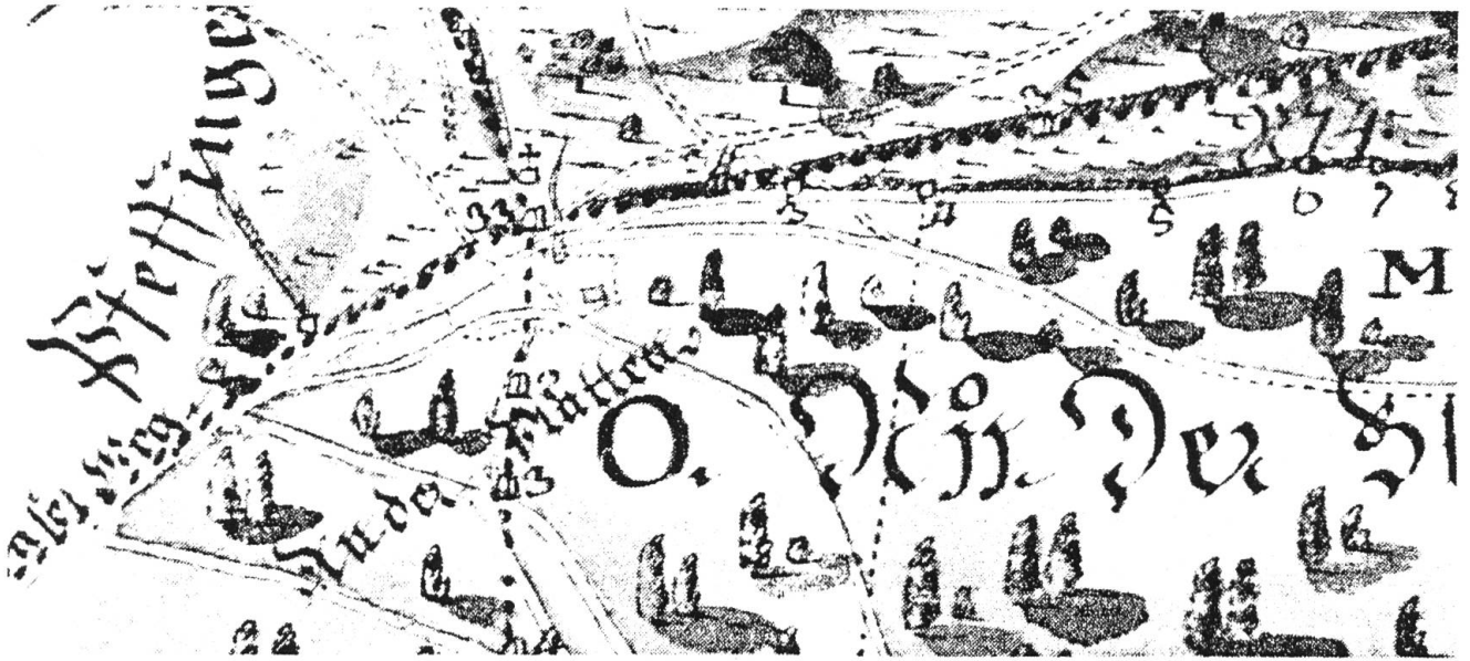
Ausschnitt aus dem «Brunnerschen»-Plan, gut sichtbar das Gebäude am Plattenpass.

Auch am Weg liegender Schutt wird dazu verwendet. Unmittelbar auf der Passhöhe, etwa 10 Meter nördlich des Grenzsteines, stiess man auf Reste eines Gebäudes mit verputzten Mauern und mit Backsteinboden.»