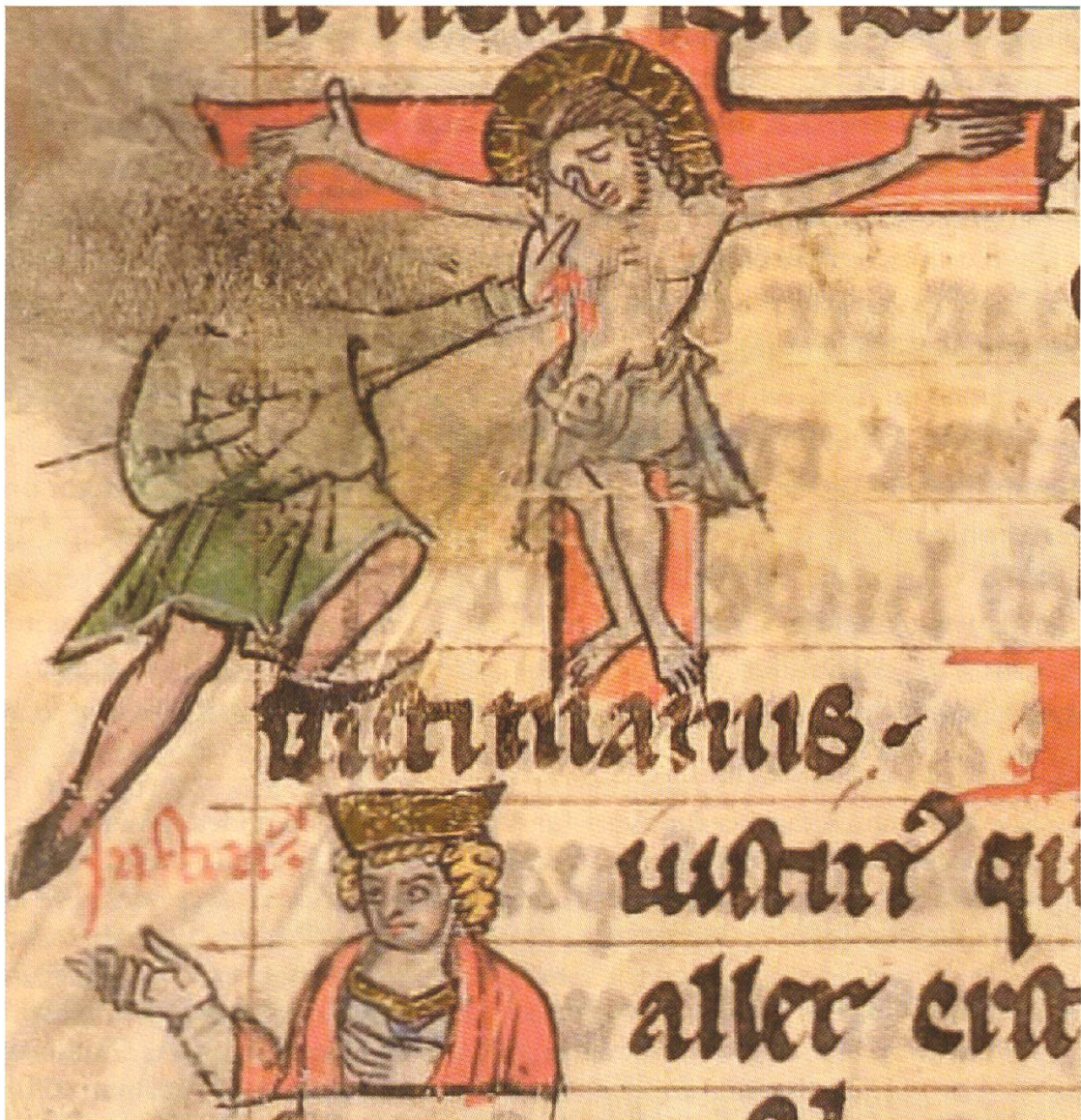
Abb. 2: Detail aus: Sächsische Weltchronik , Universitäts- und Forschungsbibliothek zu Gotha, Ms. memb. I 90, fol. 62v (um 1270):

Ein Jude (im Bild ist der Judenhut noch knapp sichtbar) schändet ein Kruzifix, das er mit seiner linken Hand festhält; in der rechten Hand trägt er einen Spiess, mit dem er die Seitenwunde Christi erneuert, bis Blut heraustritt. Das Gesicht des Übeltäters wurde gezielt unkenntlich gemacht. Es ist das einzige beschädigte Bild in der gesamten Handschrift! Der handschriftliche Text neben der Illustration lautet: In den tiden stal en iode en cruce dat stac he an den siden dat vloc uot dat bluot de iode wart gestenet dat bluot wart behalden (Zu diesen Zeiten stahl ein Jude ein Kreuz; das stach er in die Seite, so dass Blut herausfloss; der Jude wurde gesteinigt, das Blut wurde aufbewahrt).