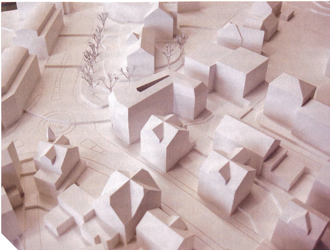
Modelle helfen, auch Freiräume zu verstehen

CE: Die Zugänglichkeit spielt dabei eine zentrale Rolle. In Zürich steht das Modell mitten in der Stadt und ist öffentlich zugänglich. Das Stadtmodell darf nicht nur den Fachleuten vorbehalten bleiben. Die Baukultur wird von vielen Faktoren geprägt. Sie hängt auch von der Diskussionsbereitschaft ab. Das Mo-