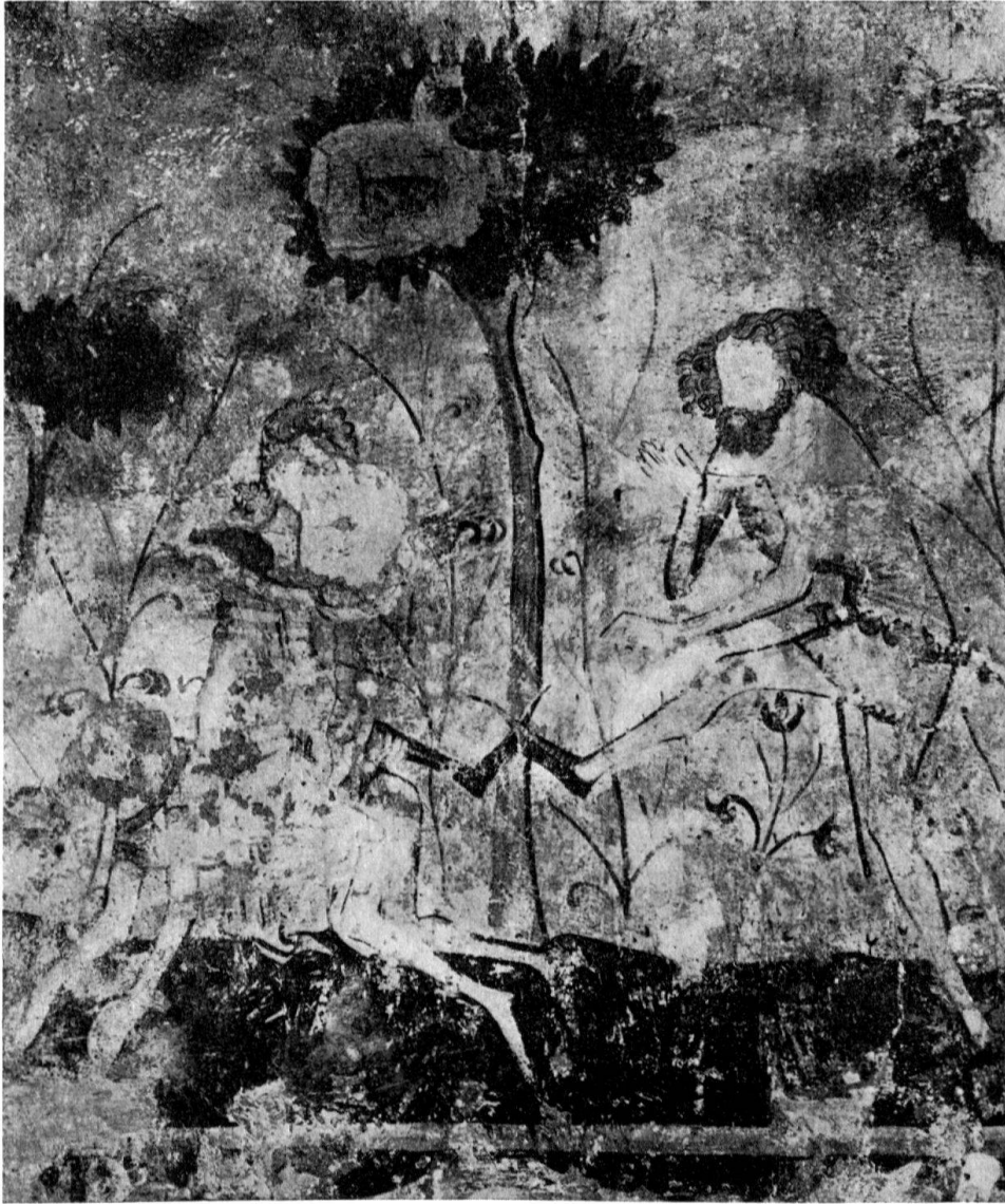
Zürich, Wandgemäldedetail aus dem Hause Rindermarkt 20/Leuengasse 17. Jetzt im Kunsthaus Zürich. Darstellungen der Weibermacht: Szene mit Quintanaspiel. 2. Hälfte 14. Jh.