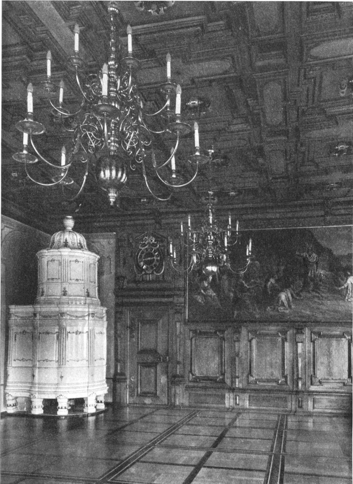
Luzern, Rathaus. Rats- und Gerichtssaal, von 1604 bis 1605