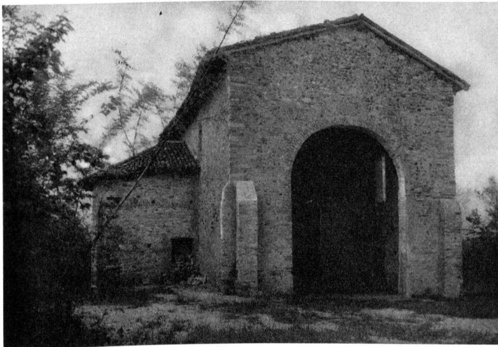
Castel Seprio, église contenant des fresques byzantines