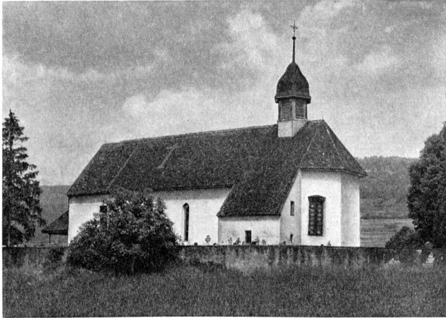
Stüßlingen (Kt. Solothurn). Alte Kirche

kommen könnte. Der Lokalverkehr zwischen Städtchen und Sittertal würde sich dann abseits der Autostraße auf der Holzbrücke abwickeln, was vor allem den Schulkindern zugute käme. Hoffen wir, es lasse sich dergestalt das Schöne mit dem Nützlichen verbinden.