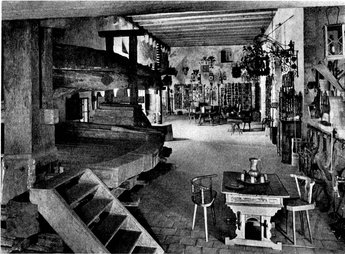
Schloß Lenzburg, Erdgeschoß des Ritterhauses mit Sammlung.