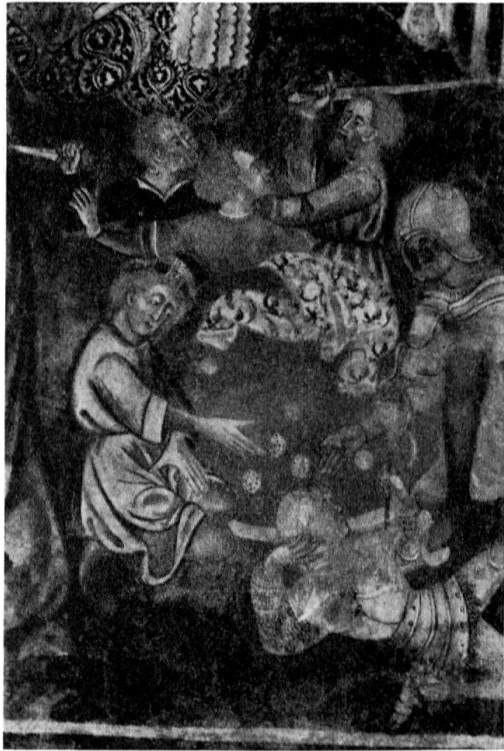
Particolare della crocefissione