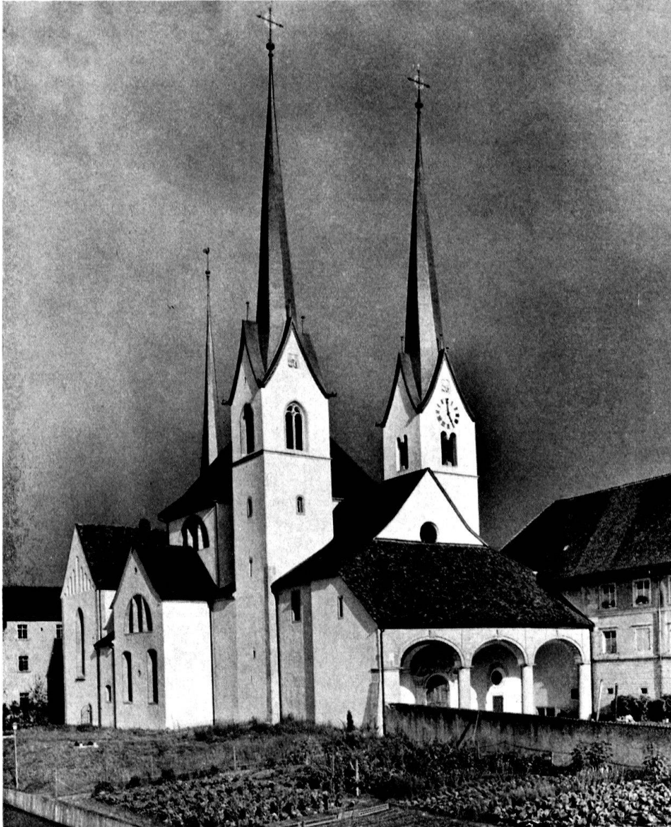
Muri, Klosterkirche. Äußeres von Nordwesten

Bei der gegenwärtigen Neuaufstellung hat man die köstlichen Glasgemälde, die von der Firma Süß und Glasmaler F. Dold, Zürich, sorgfältig restauriert wurden, durch eine feste Montierung und hofwärts vorgesezte Schutzgläser gesichert. Für die richtige Abfolge und Anordnungsweise der Fenster, wie sie offenbar seit der Preisgabe des nördlichen Kreuzgangarmes zu Ende des 17. Jhs. bis zur Klosteraufhebung (1841) bestanden haben, waren zeitgenössische Beschreibungen und bildliche Darstellungen richtungweisend. Der West- und der Südflügel des Kreuzganges bergen die Wappenscheiben von befreundeten Klöstern und Städten, weltlichen und geistlichen Herren und Fürsten, der Ostflügel die Schilde von sieben eidgenössischen Orten. Diese farbenprächtigt leuchtenden Wappenschilder fügen sich jeweils mit den erneuerten Mondscheiben und den ganz ausgezeichneten Maßwerk-Glasgemälden in noch mittelalterlichem Geiste zu einer architekturgebundenen