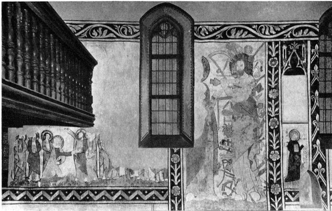
Ormalingen, Kirche. Wandgemälde aus dem Ende des 14. Jahrhunderts