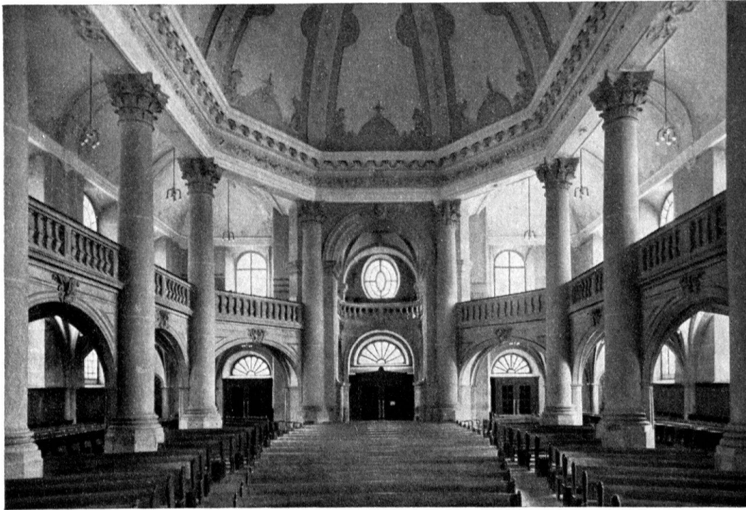
Innenansicht gegen Turmhalle und Haupteingang.

noch deutlicher, in der nahezu identischen Gliederung der Turmschäfte bis zu den vier Zifferblättern liegt der Zusammenhang zwischen beiden Kirchenbauten klar zutage. Das gilt nicht nur vom Innenraum. Die Außengliederung der Längsseiten ist der Straßenseite von Aldrichs All Saints in Oxford (1707–1710) aufs unmittelbarste verwandt. Aber auch hierin führen die Bezüge immer wieder mitten ins Werk von Wren selbst hinein. Die große Portal-Aedicula der Heiliggeist-Hauptfront ist eine kaum variierte Replik des Portals am Old Ashmolean Museum (1683) in der gleichen Stadt.