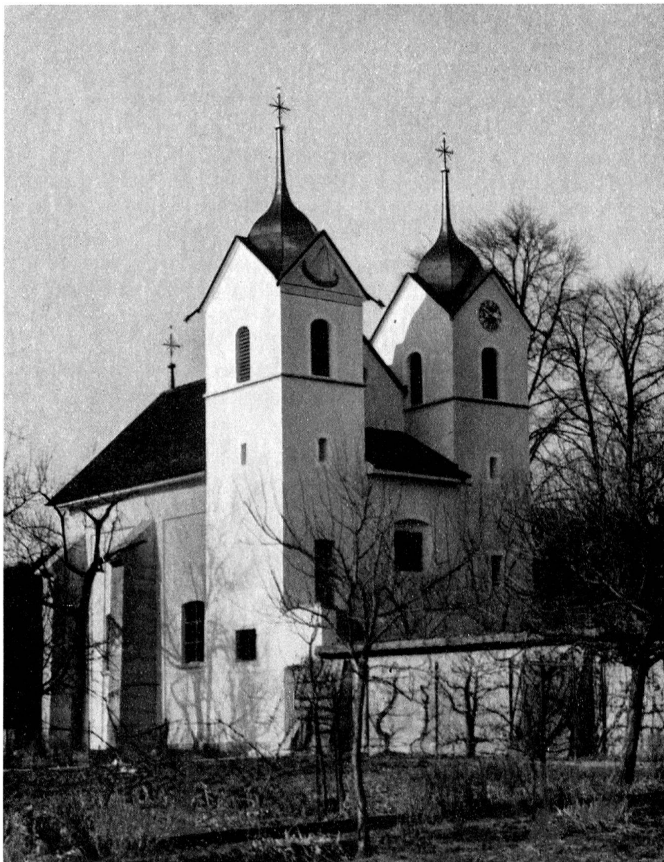
SCHLOSSKAPELLE BÖTTSTEIN (KT. AARGAU)

Die Schloßkapelle in Böttstein, eine der reizvollsten Barockarchitekturen des Aargaus, erfreut sich seit wenigen Wochen wieder ihrer ursprünglichen Schönheit. Nachdem man das mit vortrefflichen italienischen Stukkaturen reich ausgestattete Innere dieses herrschaftlichen Gotteshauses bereits vor zwei Jahrzehnten sorgfältig renoviert hatte, ist nun auch dessen arg verwahrlostes Äußeres stilgerecht erneuert worden.