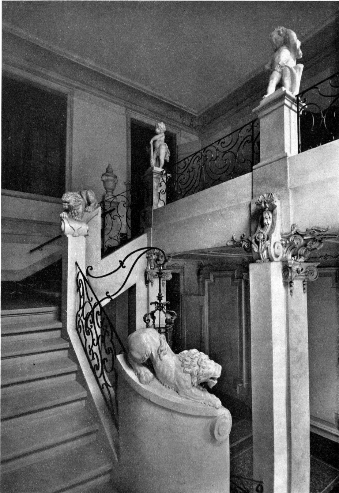
Treppe mit Löwen und Putten im Haus Marcuard, Amtshausgasse 5, Bern. Erbaut 1764 für Landvogt Rudolf von Fischer. – Siehe Seite 5