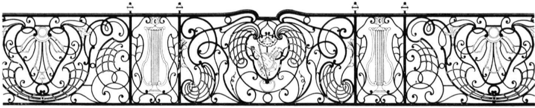
Balkongeländer an der Westfassade des Hôtel de Musique in Bern. 1769