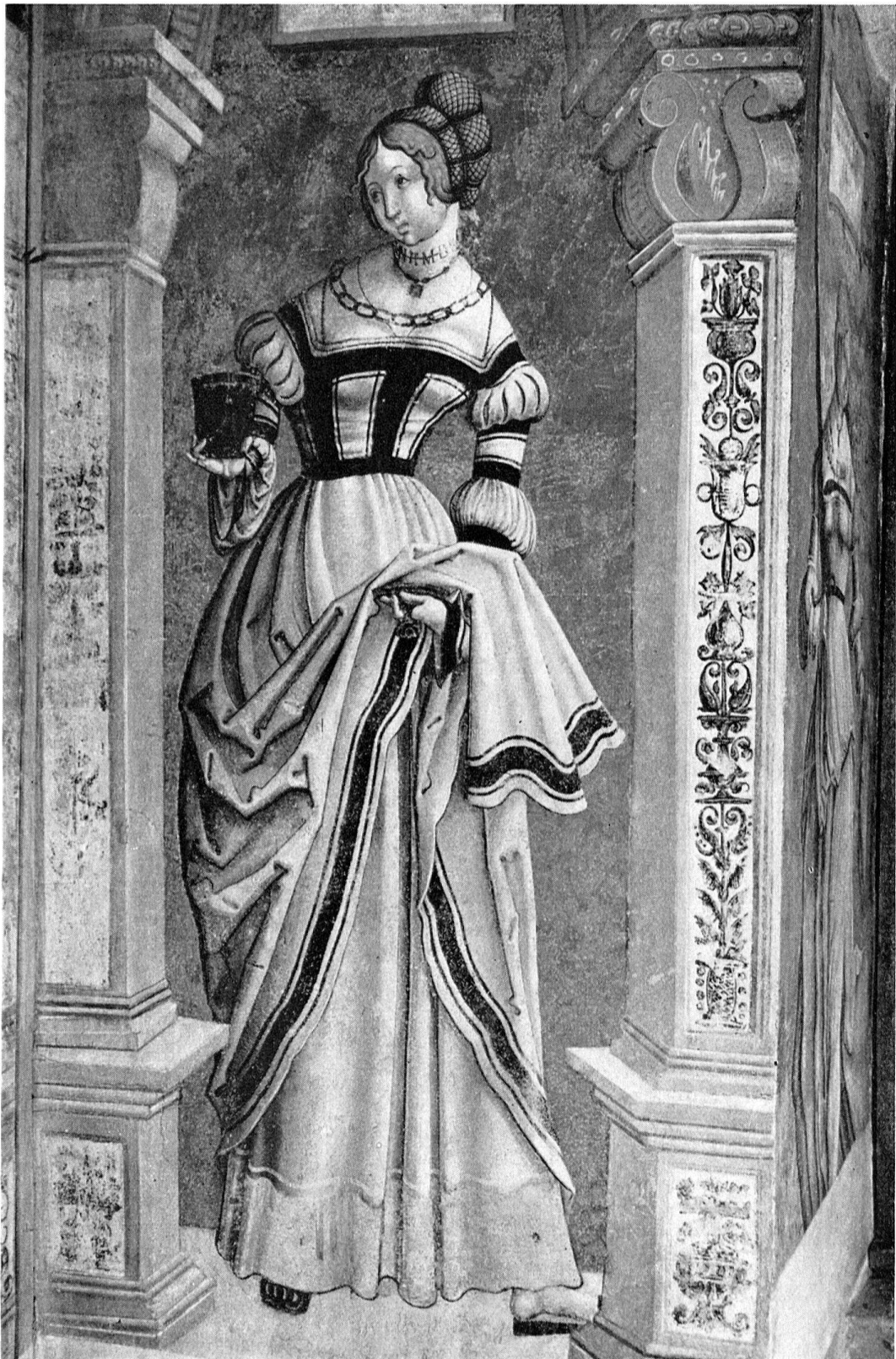
«Artemisia» aus dem Bildersaal des Abtes David von Winkelsheim. 1515/16. Kloster St. Georgen in Stein am Rhein. – Siehe Seite 4