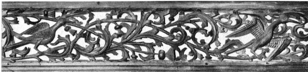
Gotische Zierleisten in der oberen Stube des Abtes David. Kloster St. Georgen in Stein am Rhein