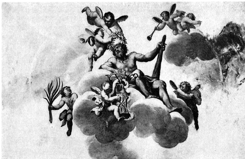
Mendrisio, Palazzo Pollini. Fresques (voir p. 17)