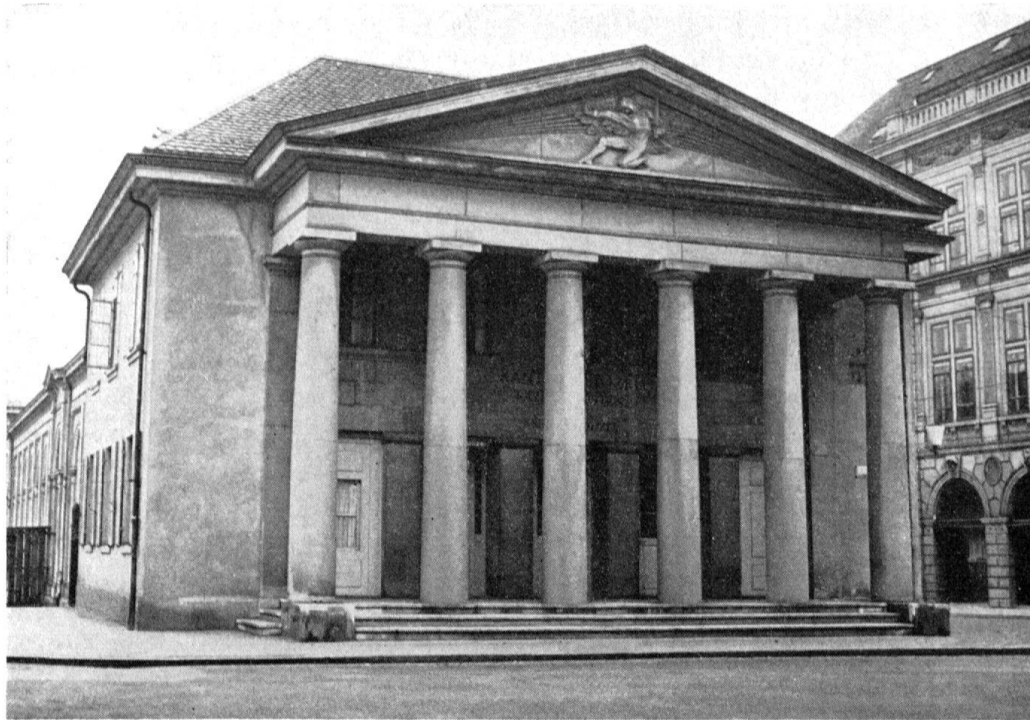
Zürich, Hauptwache. Erbaut 1824–25 von Hans Caspar Escher

mus, deren übrige Zeugen in Zürich fast ausgerottet sind: der schöne Sihlgarten und seine Verwandten am Talacker sind verschwunden, das Haus zur Palme am Bleicherweg ist nicht zu halten – aber dieser strenge und kühle Stil, der das durch die Revolution mündig gewordene Bürgertum repräsentiert, darf in Zürich sehr wohl zu Wort kommen.