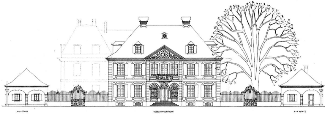
Straßenfront der «Sandgrube» in Basel. Heutiger Zustand nach der Zeichnung von Arch. Fritz Lauber. Links der entfernte Anbau aus der Mitte des 19. Jhs.