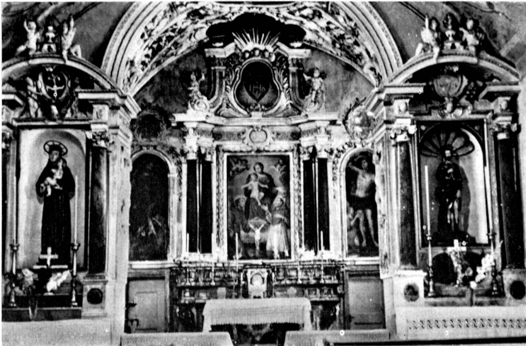
Cappella di San Rocco e San Sebastiano in Grono

I lettori del nostro «Bollettino» hanno potuto seguire, attraverso l'autorevole parola di Erwin Poeschel, le fasi più importanti della lotta per la salvezza di questo edificio e della Piazzetta caratteristica che l'edificio stesso determina. (Cfr. No. 2 e No. 3, 1958.) Dopo che il Gran Consiglio del Cantone Grigioni ebbe deciso definitivamente la circonvallazione del villaggio, un attivo Comitato, diretto dal dinamico parroco di Grono Don