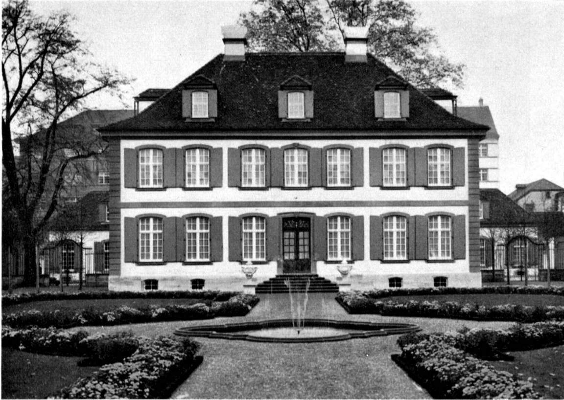
Gartenfassade der «Sandgrube» nach der Wiederherstellung

Fr. 4 500 000.—. Als eingreifende bauliche Veränderung ist vor allem die Verlängerung des Herrschaftshauses um die Mitte des 19. Jhs. zu erwähnen. Im großen und ganzen blieb die Gesamtanlage während fast zweihundert Jahren die ursprüngliche: gegen die Straße hin öffnet sich hinter einem prachtvollen Gitter ein breitrechteckiger Hof, flankiert von pavillonartigen einstöckigen Dienstbauten und Remisen. Das zweistöckige, in der Hauptachse liegende Herrschaftshaus, mit seinen seitlichen Gartengittern, schließt den Platz gegen Süden ab.