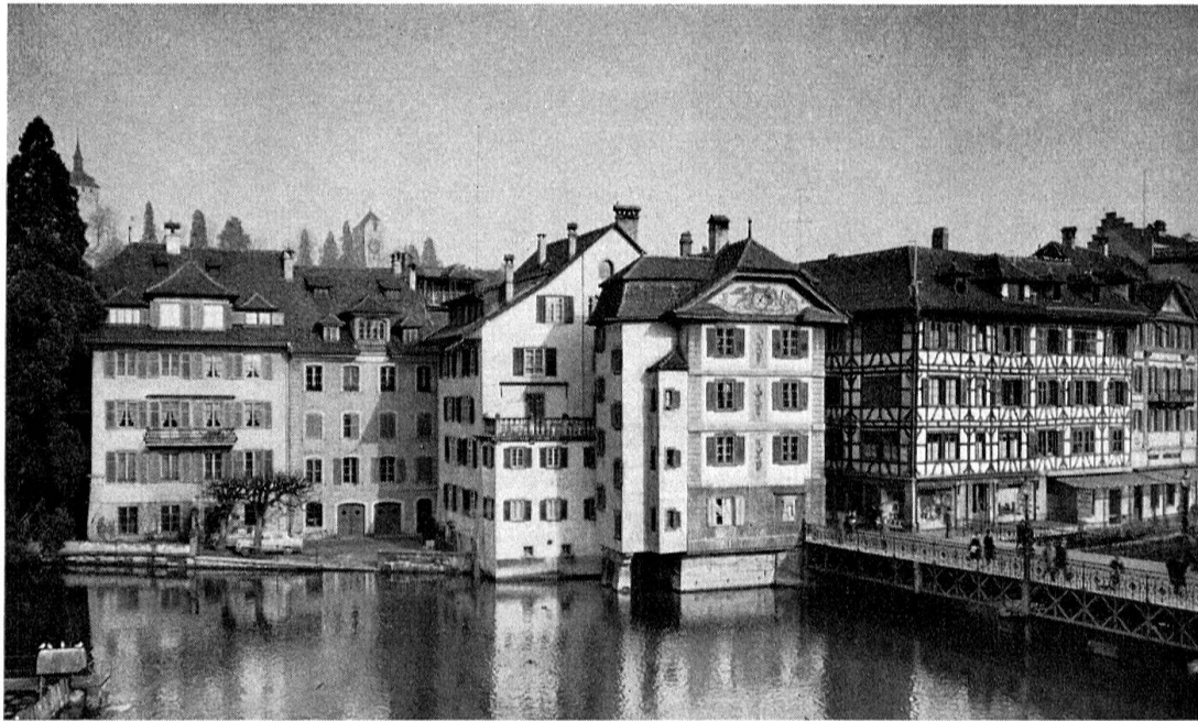
Luzern. Links der Brücke, Häuserfront «im Zöpfli». Rechts, Leszinski-Haus