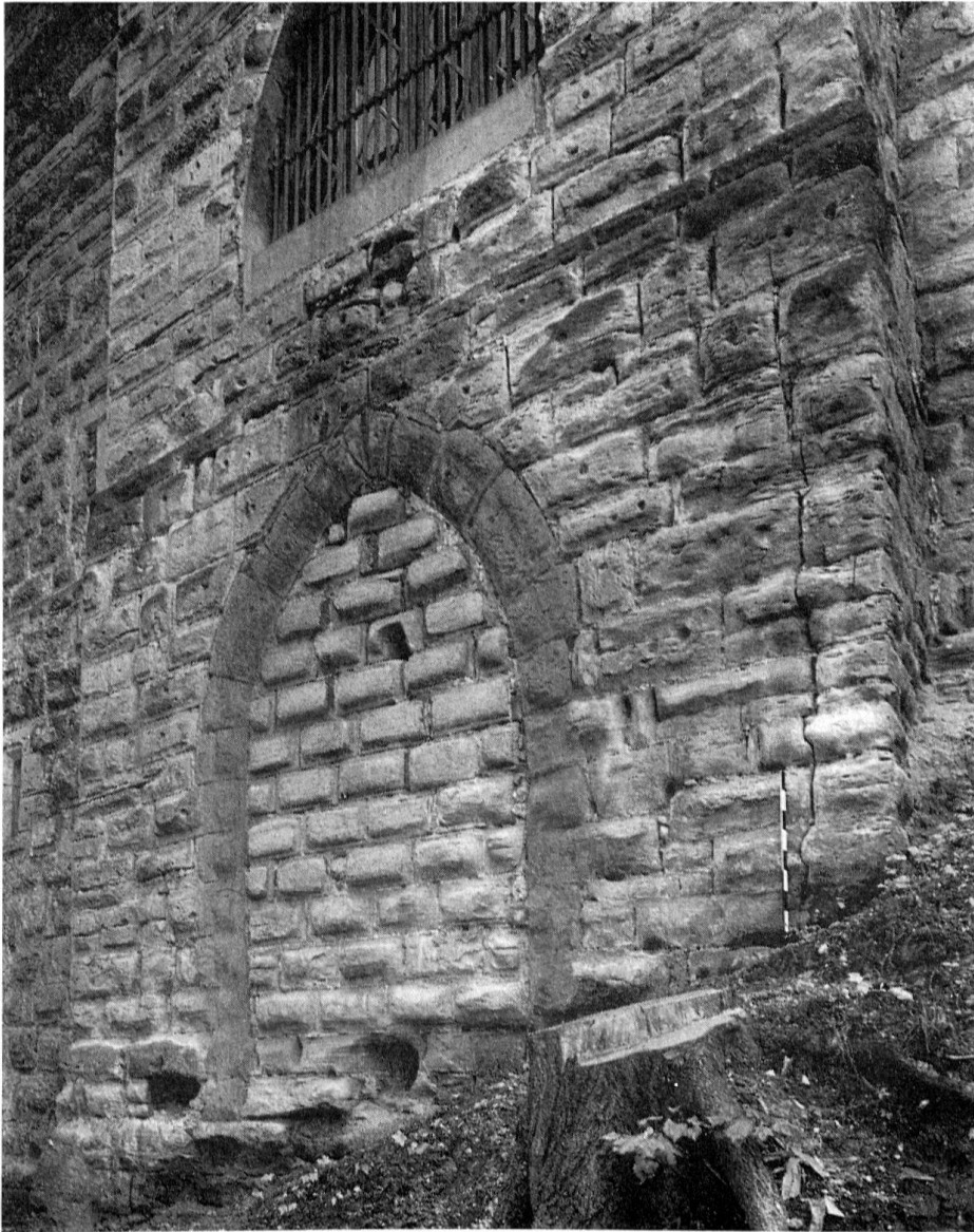
Burgdorf, Schloß. Der zugemauerte Torbogen an der Nordseite

ursprüngliche Bearbeitung der Quader mit der Zahnfläche festgestellt werden, da und dort findet sich ein für die Wende vom 12. zum 13. Jh. typisches Steinmetzzeichen. Verschiedene Beobachtungen lassen vermuten, das Tor sei nur ganz kurze Zeit benützt worden. Man sieht beispielsweise in den Falzen und im Schlitz des Fallgitters keine Spur einer Abnützung. – Im nächsten Jahr soll die ganze Vermauerung entfernt und die Torhalle zugänglich gemacht werden. Dann wird die alte Schwelle zu sehen sein, die vielleicht ergänzende Schlüsse erlaubt. Die gewaltige plastische und räumliche Wirkung von Torbogen und Torhalle kann man bis zu diesem Augenblick nur ahnen.