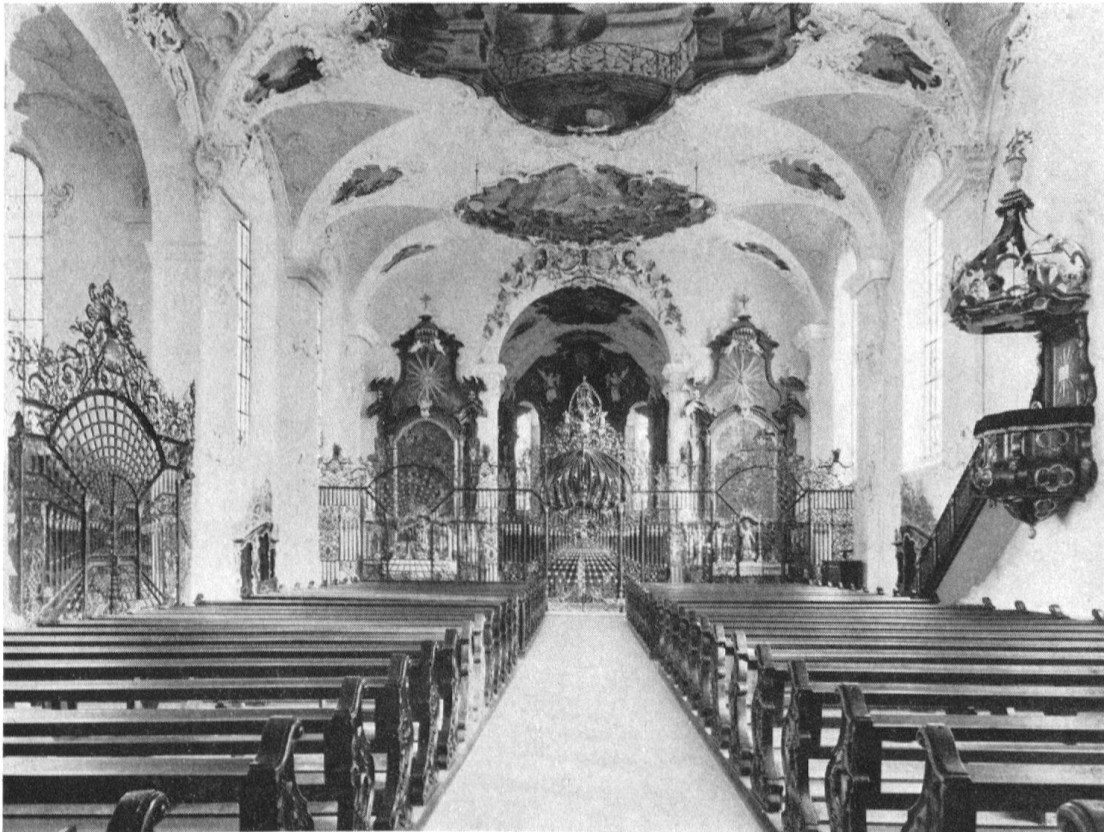
Kreuzlingen, Augustinerkirche. Inneres mit Blick gegen den Chor

eingeführt wurden und denen der zu früh verstorbene Konservator Max Bendel 1938 im Schaffhauser Allerheiligenmuseum eine Ausstellung gewidmet hatte. Das Innere der Kirche wurde vor zwei Generationen in der damals üblichen Weise gutmeinend verrestauriert, indem man den farbigen Rokokostuck weiß strich und mit Goldrändern «staffierte»; dem Kirchturm hatte man schon 1899 einen gequälten, scheinbarocken Abschluß aufgezwängt.