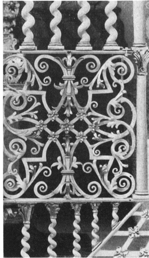
Kreuzlingen, Augustinerkirche. Details des Chorgitters. Jakob Hoffner, 1737

hindurch das Vorchor mit seinen Seitenaltären und das tiefe Chor wie durch einen Spitzenschleier hindurch erblickt. Die Schweiz besitzt noch ein weiteres Prunkgitter des Konstanzer Meisters, das der Klosterkirche von Muri, seit über einem Jahrhundert schwarz gestrichen, dessen ursprüngliche Fassung wir noch nicht kennen.