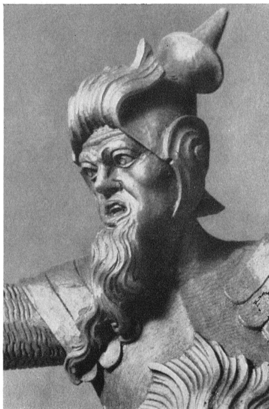
Kreuzlingen, Augustinerkirche. Details von Figuren aus der barocken Ölberggruppe von 1720/40