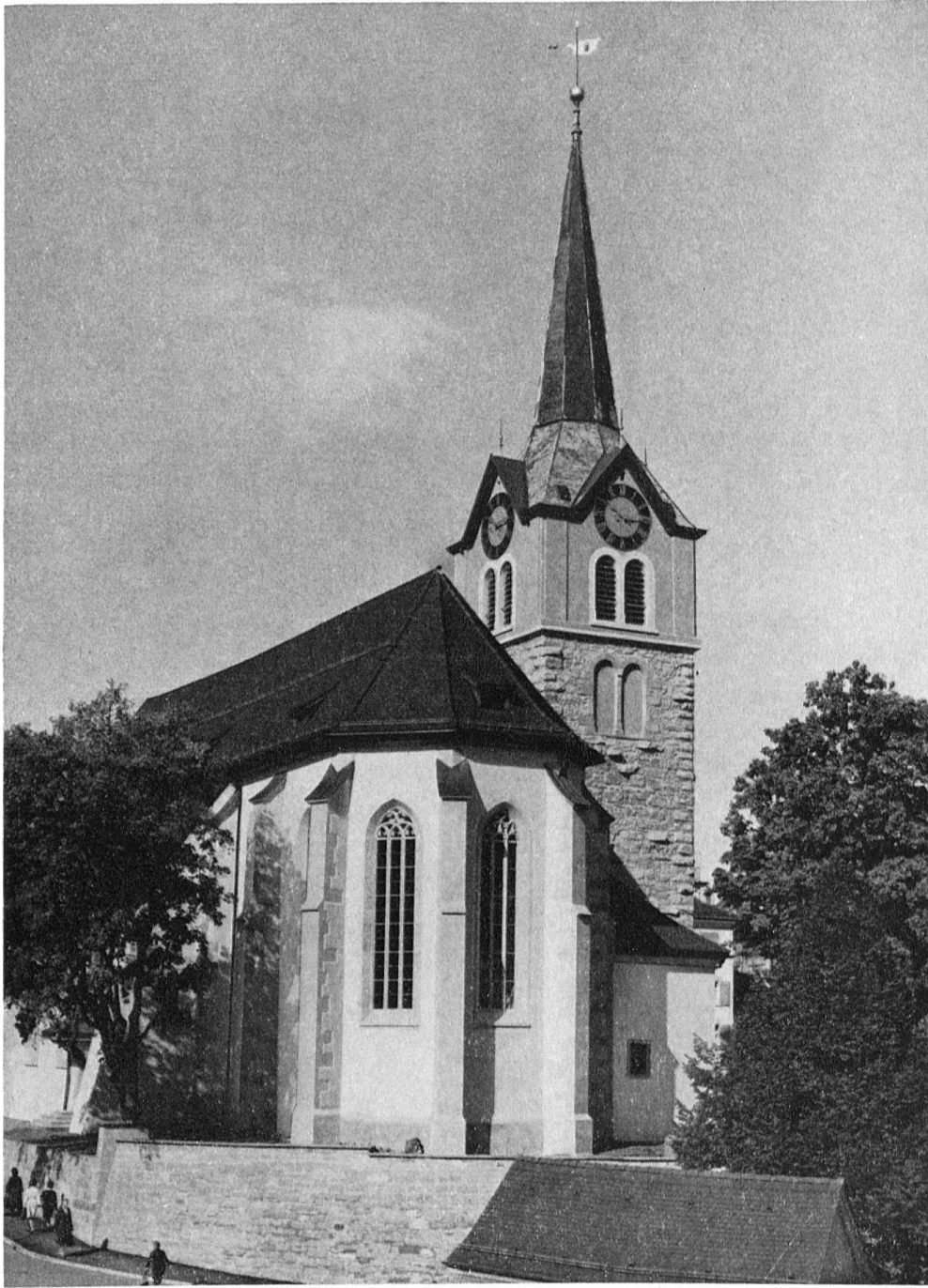
Pfarrkirche von Herisau. Außenansicht von Osten

und in eine Farbigkeit versetzt, die zwar ungewohnt wirkt, aber im Grunde jener Folgerichtigkeit entspricht, mit der schon längst auch barocke Fassungen, bisweilen allerdings unbedenklich, aufgefrischt werden.