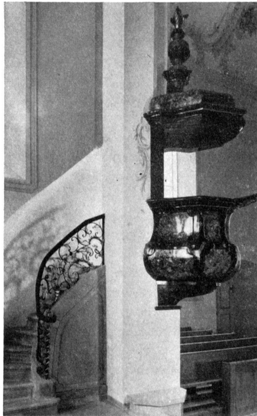
Die barocke Kanzel mit Rokokogeländer

(jedenfalls nicht aus romanischer Zeit, vielleicht aus dem Beginn des 16. Jhs.). Die Restaurierung begnügte sich mit dem Neuperputz des Glockengeschosses, der Neubemalung der Uhr und damit, das unschöne Herausragen des Glockengeschosses durch das Brechen der äussersten Kanten etwas zu vermindern.