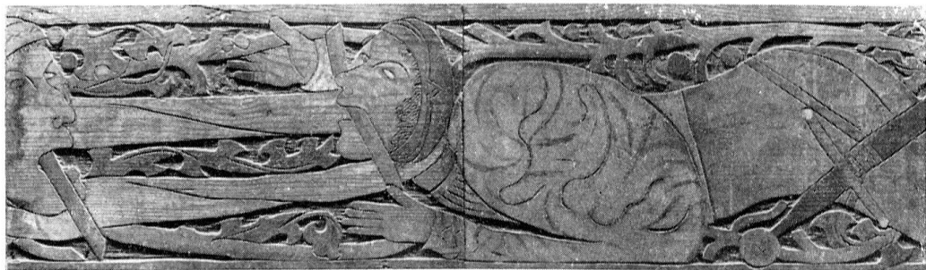
Detail der Flachschnitzerei aus dem ehemaligen Kloster Rheinau