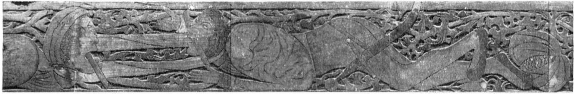
Spätgotische Flachschnitzerei aus dem ehemaligen Kloster Rheinau

Abt Eberhard II. in der Mitte des 15. Jhs. entstandenen Klosterflügels 1 stammen, in kurze Abschnitte von 55 cm Länge zersägt und als Schrägbodenbretter verwendet worden. Die üblichen Motive wie Blattranken, Blüten, Früchte, ferner Vögel und Affen in drolligen Situationen finden sich vor. Außerdem ließen sich fünf Bretter zu einer einheitlichen Darstellung eines Spieles zusammenfügen, das als Katzenstriegelziehen zu deuten ist 2 . Es handelt sich darum, daß zwei Partner sich ein breites, in sich geschlossenes Band um die Nacken schlingen und versuchen, sich auf Knie und Hände stützend, sich über eine vorher markierte Linie oder, wenn in einem Hause gespielt wird, über eine Türschwelle zu ziehen. Dazu sollen Spieler und Zuschauer miau gerufen haben 3 . Verloren hat derjenige, der das Band über seinen Kopf gleiten lassen muß. Dieses Spiel ist vom 15. bis zum 17. Jh., zum Teil sogar bis in die Gegenwart nicht nur in der deutschen Schweiz, sondern auch in Deutschland nachgewiesen. 4