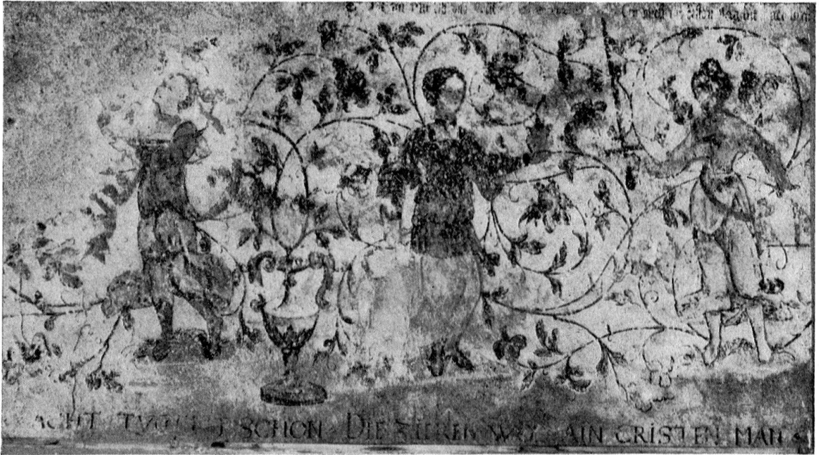
Wandmalereien im Hause Ebneten in Appenzell Spes, Caritas und Justitia