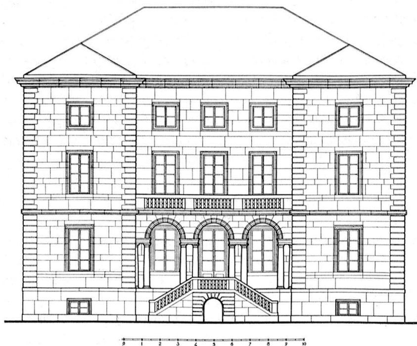
Façade sud de la Maison Louis-Auguste de Pourtalès à Neuchâtel