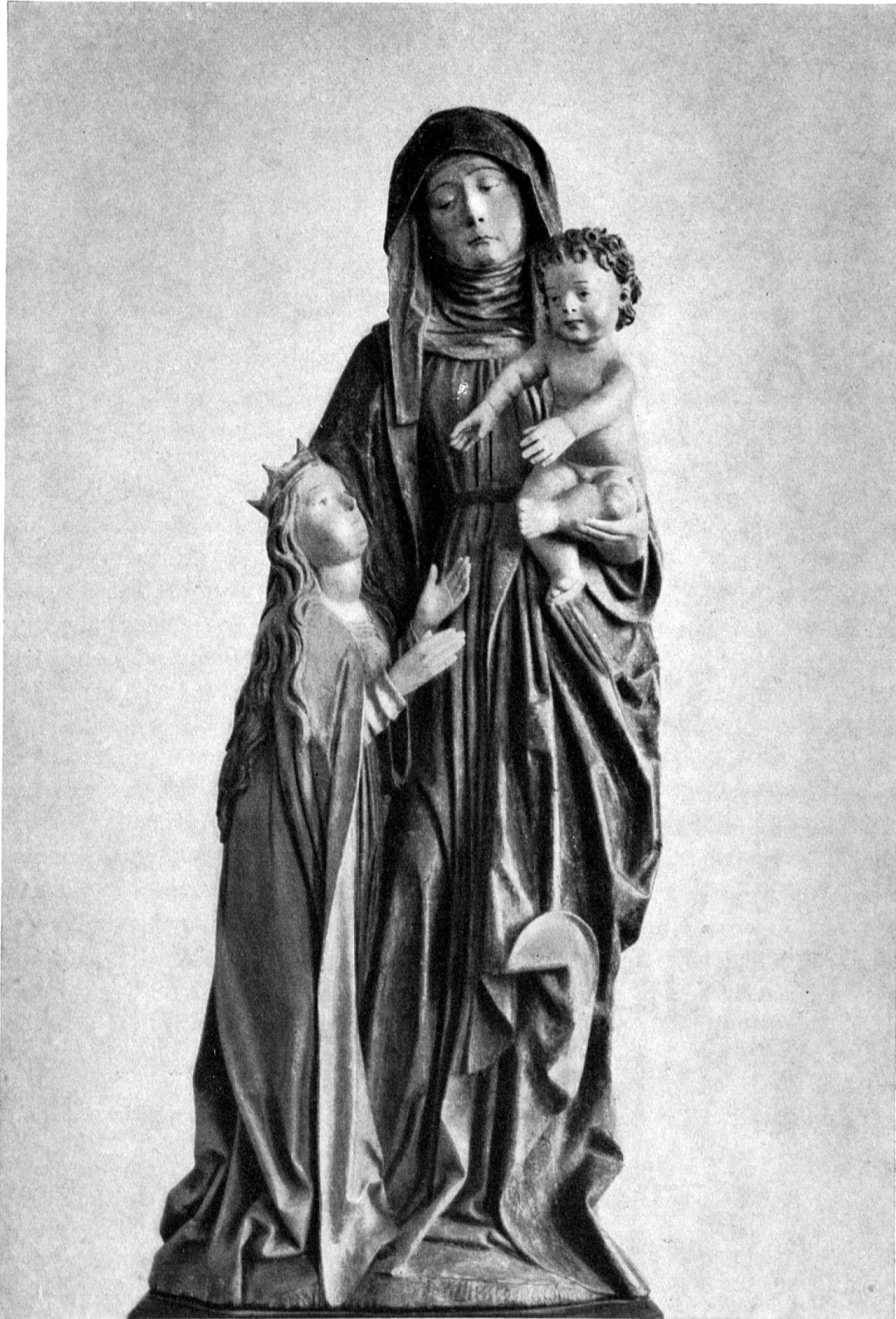
Hl. Anna selbdritt. Spätgotische Gruppe aus der Zeit um 1500 in der Römisch-katholischen Kirche von Rheinfelden