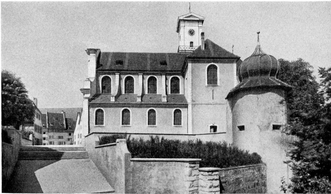
Vue extérieure (sud) de l'église St-Marcel à Delémont construite de 1762 à 1773

gain de cause en prouvant à l'aide d'un document médiéval que l'entretien des édifices publics et de l'église était toujours à la charge de la ville. Et puisqu'à cette époque la coutume faisait loi, le magistrat de Delémont s'y soumit. Trois années passèrent encore à dresser les plans et à recueillir les fonds.