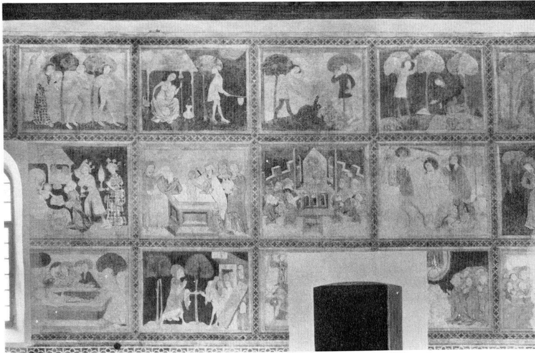
Kirche Erlenbach i. S. Bilderfolge der Nordwand. Nach der Restaurierung