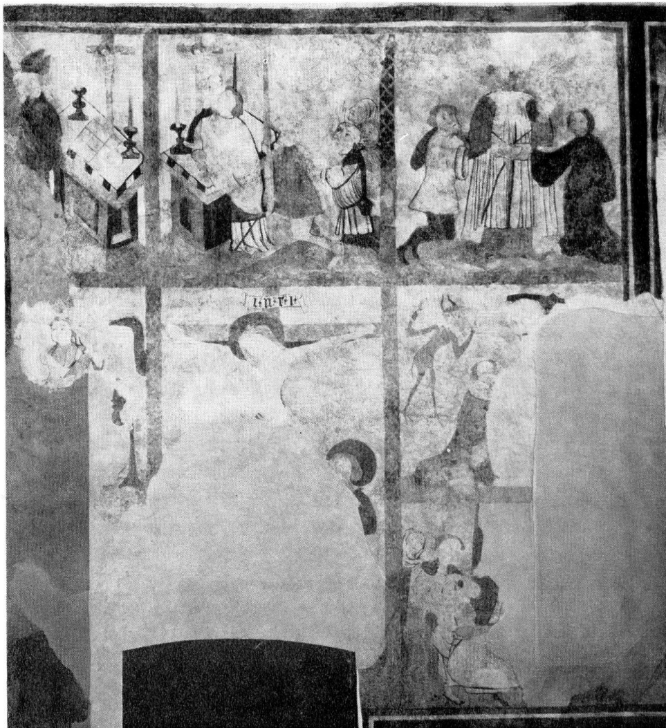
Kirche Erlenbach i. S. Darstellungen der Sakramente