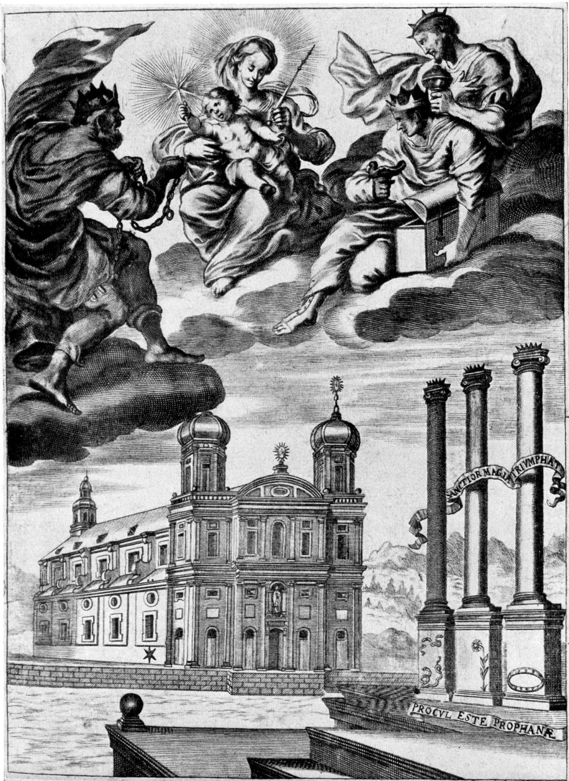
Luzern, Jesuitenkirche. Projektstich von 1666, Zentralbibliothek Luzern